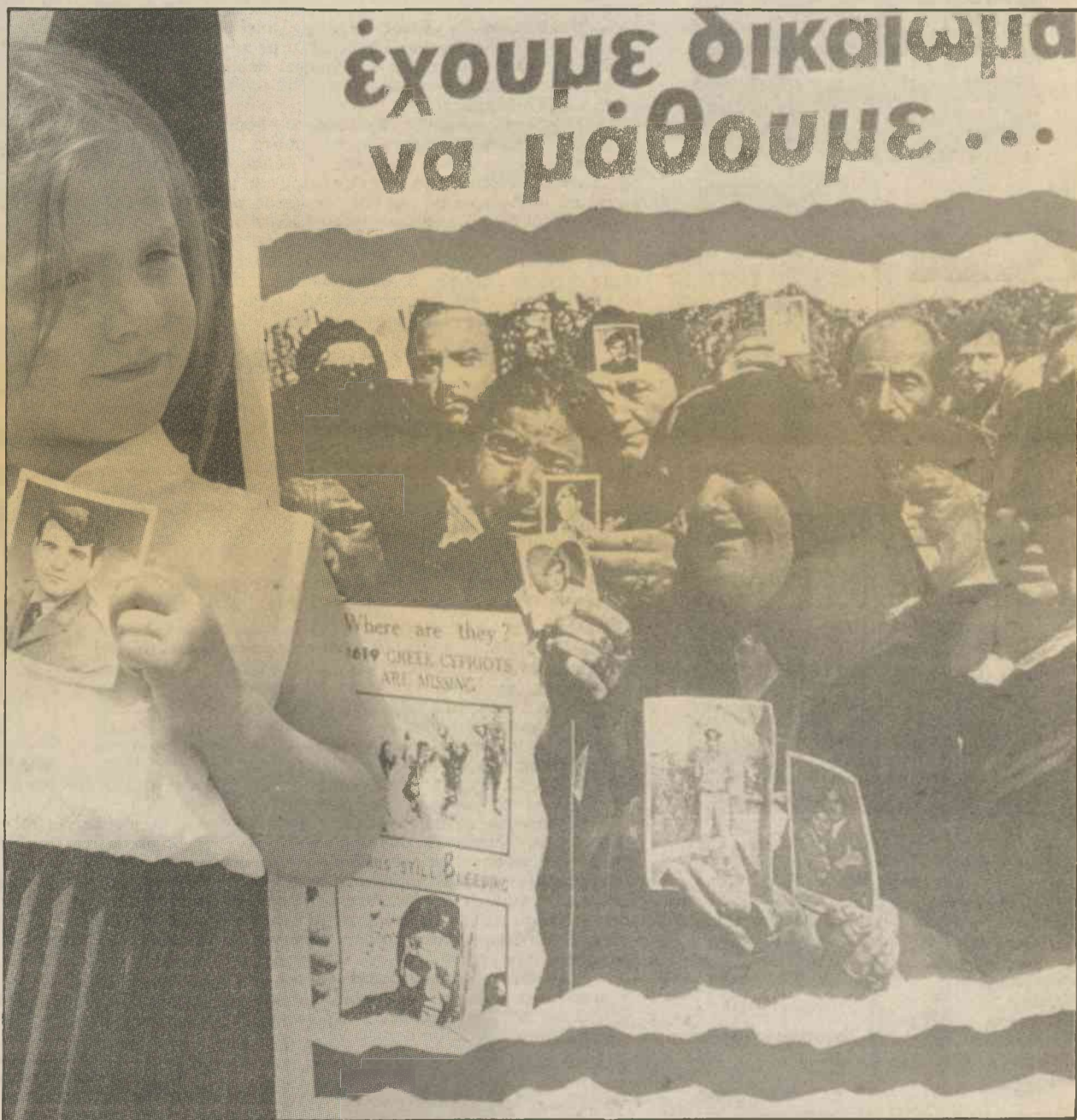
Κύπρος. Περιμένοντας για χρόνια τον αγνοούμενο πατέρα, γιο, αδελφό. Ο πρόεδρος του ΠΑΣΟΚ επισημάνει τον κίνδυνο δημιουργίας ενός, δύο, πολλών «Κυπριακών».

Η ΕΛΛΗΝΙΚΗ Κυβέρνηση έδωσε τα πάντα στους Δυτικούς «συμμάχους», κατά τον πόλεμο του Περσικού (Βάσεις, αεροδρόμια, εναέριο χώρο, διευκολύνσεις κ.λπ.) και δεν πήρε τίποτα.