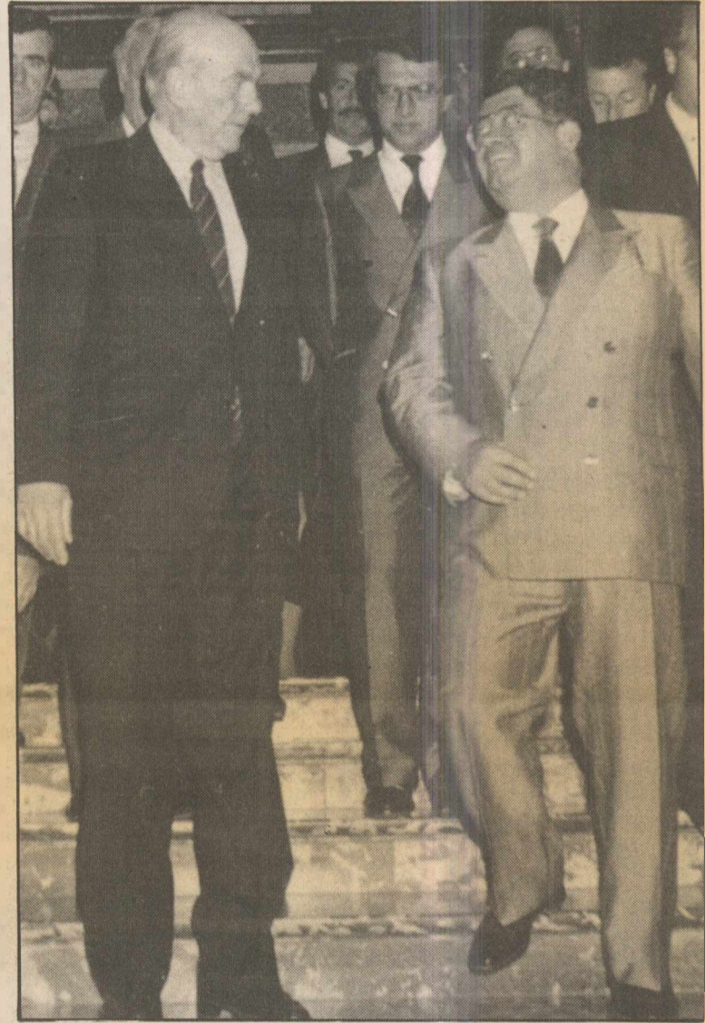
ΑΝΔΡΕΑΣ ΠΑΠΑΝΔΡΕΟΥ: Στο Νταβός (απ' όπου και το στιγμιότυπο με τον Οζάλ) αποδείχθηκε ότι η Τουρκία δεν θέλει διάλογο με την Ελλάδα.

Αντλήσαμε πόρους, με τους οποίους νοικοκυρέψαμε, κυρίως, την αγροτική περιφέρεια και επιτύχαμε στόχους που δεν απορροούν μόνο την Ελλάδα. Για παράδειγμα, τα Μεσογειακά Προγράμματα είναι δική μας επιτυχία, όπως δική μας επιτυχία είναι οι