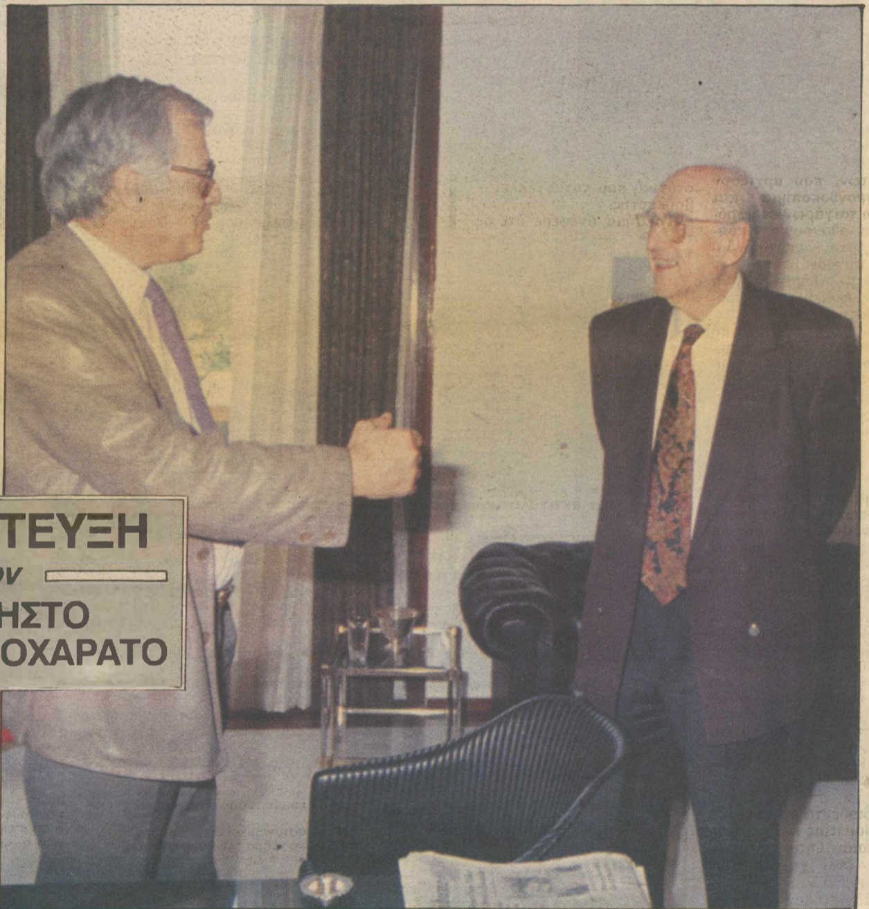
Χαμόγελα από τον Ανδρέα Παπανδρέου λίγο πριν από τη συνέντευξη που παραχώρησε στον Χρήστο Θεοχαράτο.

Αλλ' αλυστε, η προσωπικότητα που ίδρυσε ένα κόμμα και το οδήγησε στην εξουσία, αυξάνοντας τη δύναμή του με γεωμετρική πρόοδο, η προσωπικότητα που κυβέρνησε επί οκτώ χρόνια τη χώρα με