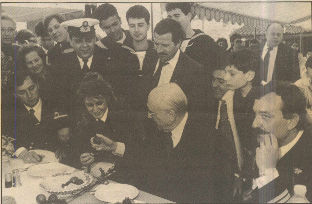
Ο Πρόεδρος του ΠΑΣΟΚ «τσουγκρίζει» τα κόκκινα αυγά με αξιωματικούς του Πολεμικού Ναυτικού, στην Κέρκυρα.

— Σας το τόνισα και στην αρχή της συζήτησής μας. Είμαι από τη φύση μου αισιόδοξος. Βεβαίως, η οικονομική κατάσταση της χώρας είναι η χειρότερη από τον πόλεμο και ύστερα. Και βεβαίως η κατάσταση χειροτερεύει. Επειδή, όμως, στην Ελλάδα το οικονομικό πρόβλημα ήταν πάντα κυρίως πολιτικό, πιστεύω ότι με μια άλλη πολιτική η κακή πορεία θα αναστραφεί. Όπως πιστεύω, ακόμη, ότι σύντομα ο Λαός μας θα επιβάλει αυτή την άλλη πολιτική.