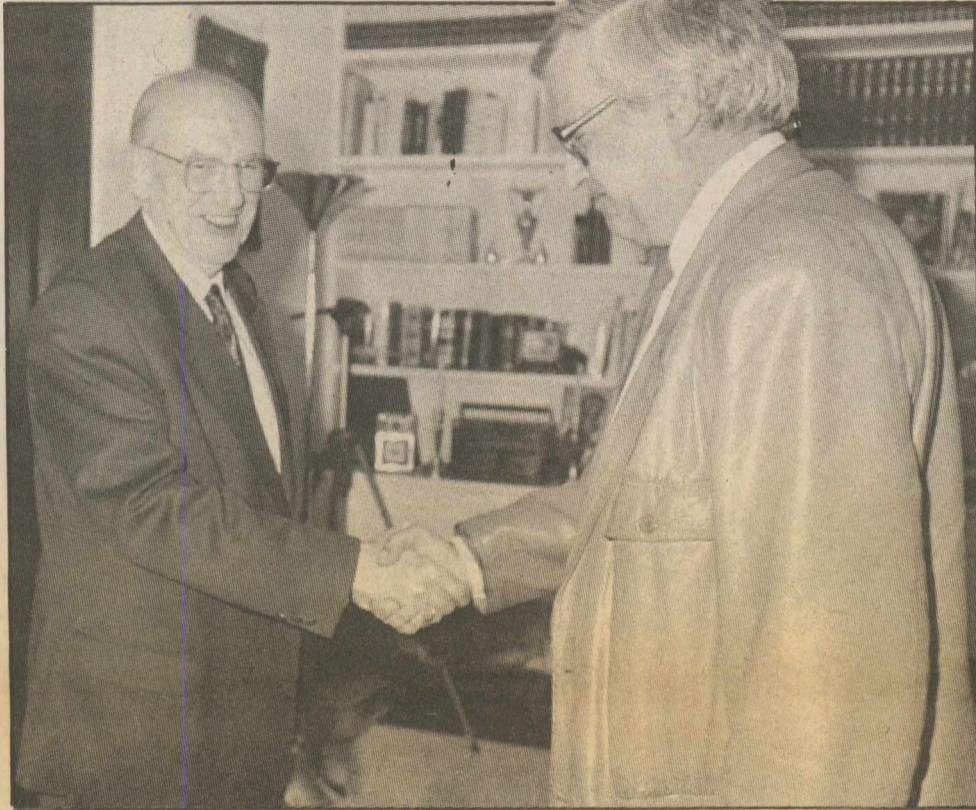
Χειραφία του Α. Παπανδρέου με τον Χρ. Θεοχαράτο, πριν από τη συνέντευξη.

— Στην αναφορά σας για την επίθεση που δέχονται οι δημοκρατικές κατακτήσεις υπήρχε και τρίτο σκέλος: Τα νομοθετικά μέτρα. Σε ποια, κυρίως, αναφέρατε, κ. Πρόεδρε;