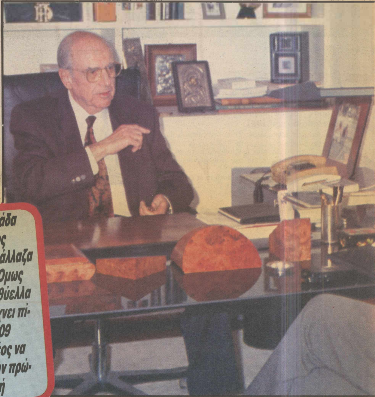
Ο Ανδρέας Παπανδρέου καθισμένος στο λιτό και απέραντο γραφείο του σπιτιού του στην Εκάλη

— Ναι. Το κατανοώ, δυστυχώς. Το κλίμα δεν προσφέρεται. Και αντί ο αγώνας να είναι πολυσχιδής, αλλά ένας και ενιαίος — κάτι που πρέπει απέναντι σε κοινούς