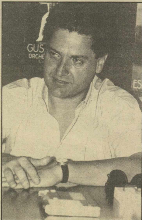
Παντελής Οικονόμου: «Οι κυκλοφορούντες στην πιάτσα ως αντικαταστάτες του Ανδρέα Παπανδρέου, ίσως να μην έχουν πολλές πιθανότητες, λόγω της υπερβολικής και ανεπίκαιρης κυκλοφορίας τους»

— Με τις προανακριτικές επιτροπές, οι αντίπαλοί του νομίζω ό τι έχουν κάνει στο ΠΑΣΟΚ