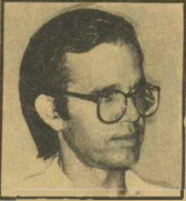
Από τον ΠΑΝΟ ΛΟΥΚΑΚΟ