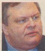
Του Ευάγγελου Βενιζέλου

Η ΚΥΒΕΡΝΗΣΗ της Νέας Δημοκρατίας συμπληρώνει έξι μήνες στην εξουσία. Αυτούς τους τελευταίους έξι μήνες της Ολυμπιακής προετοιμασίας, αντί να προσπαθεί να δημιουργήσει την εντύπωση ότι σε αυτήν οφείλεται η ολοκλήρωση των Ολυμπιακών έργων που είναι το αποτέλεσμα μιας πολυετούς επίπονης προσπάθειας και ήταν ουσιαστικά έτοιμα, έπρεπε να έχει αντιμετωπίσει όλα τα προβλήματα λειτουργικών και συμπεριφορών που σχετίζονται με τους Αγώνες και προσδιορίζουν την εικόνα που στέλνει διεθνώς η χώρα σε αυτήν την εξαιρετική της στιγμή.