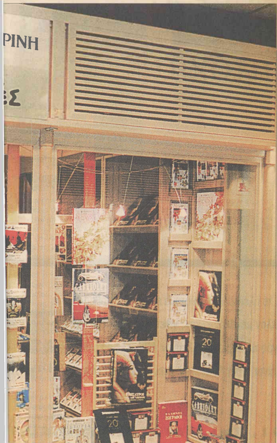
αι φίλους των εκδόσεών της, ένα νέο σημείο διάθεσης των προσφορών της. Η «Κ», σε συνεργασία με τις εκδόσεις «ΕΡΕΥΝΗΤΕΣ», στην καρδιά της εκδοτικής τριγίας: Δευτ., Τετ., Σαββ.: 10.00-15.00, Τρ., Πέμπ., Παρ.: 10.00-19.00.