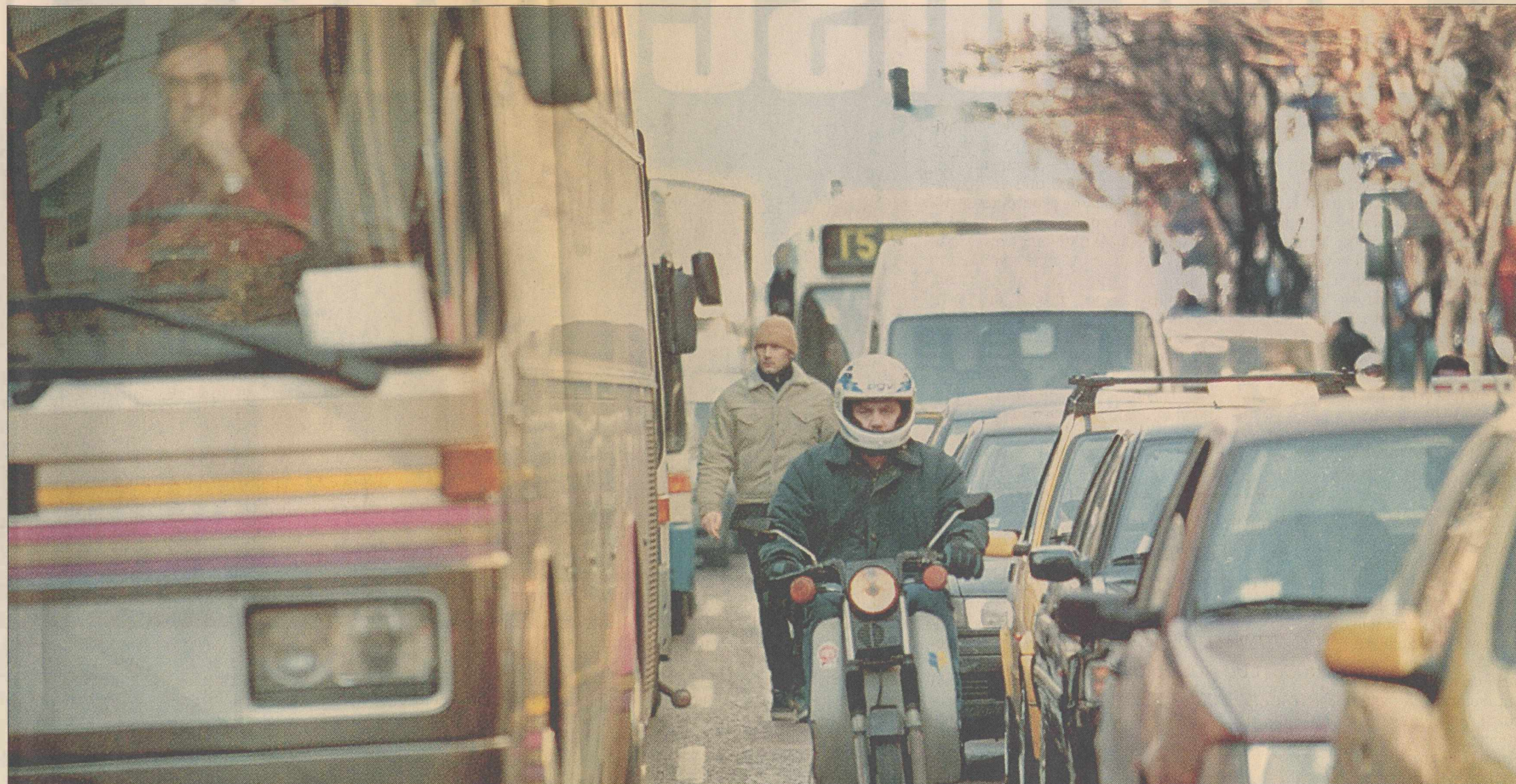
Καθημερινό φαινόμενο το μποτιλιάρισμα στους δρόμους της Αθήνας. Τι θα γίνει άραγε το 2004 όταν χρειασθεί να μετακινηθούν 6-7 εκατομμύρια θεατές;

Ζοφερή κατάσταση για τις καθυστερήσεις σε όλα τα έργα του συγκοινωνιακού δικτύου παρουσιάζει έγκυρη έκθεση