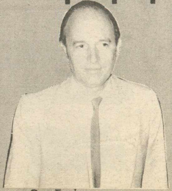
Ο κ. Σημίτης

Κατά τη συνεργασία τους συζητήθηκε η «περίπτωση Σημίτη». Επίσης, συζητήθηκαν συγκεκριμένα ονόματα υπουργών - υφυπουργών, που φεύγουν από την κυβέρνηση, όπως και υποψήφιων για το νέο κυβερνητικό σχήμα. Χτες, ο κ. Πρωθυπουργός είχε συνεργασία με τον πρόεδρο της Εξεταστικής Επιτροπής για το «Φάκελο της Κύπρου» κ. Χρήστο Μπασαγιάννη.