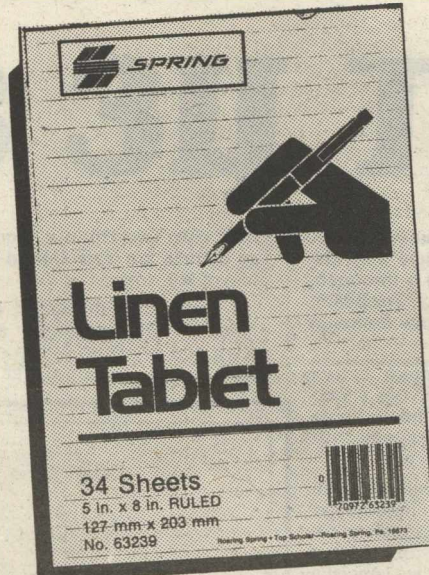
Σε αμερικάνικο μπλοκάκι, σαν και τούτο, γράφει τις σημειώσεις του ο Κοσκωτάς από τη φυλακή του Σάλεμ

Τον Ιούλιο του 88 όταν σταμάτησε ο έλεγχος της Τ.Ε. συνάντησα τον Μένιο και του είπα, ότι οι καταθέσεις είχαν πέσει χαμηλά, διότι πολλός κόσμος διαβάζοντας τις εφημερίδες φοβήθηκε και επήρε τα χρήματά του από την Τράπεζα. Μου είπε ότι θα μιλήσει με υπουργούς και θα