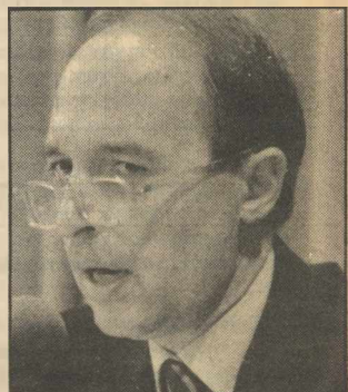
Σημίτης: Οι οπαδοί της Ν.Δ. τον προτιμούν από τον Γ. Γεννηματά