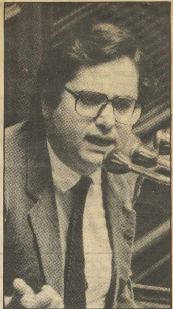
Ανδριανόπουλος: Καθώς βρίσκεται εκτός κυβέρνησης, πολλοί πιστεύουν ότι ο ρόλος του θα πρέπει να αναβαθμιστεί

★ Το ΔΞ/ΔΑ που υπάρχει, ως πρώτη απάντηση σε κάθε πίνακα, σημαίνει ότι κάποιος ερωτώμενος απάντησαν: Δεν Ξέρω - Δεν Απαντώ.