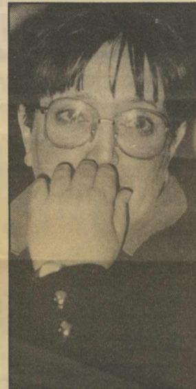
Παπαρήγα: Η γ.γ. του ΚΚΕ βρίσκεται χαμηλά στην προτίμηση των ερωτηθέντων - ακόμα και των οπαδών του ΣΥΝ