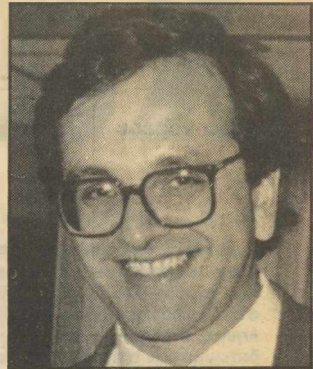
Σαμαράς: Οι οπαδοί της Ν.Δ. θα ήθελαν την ενίσχυση του πολιτικού του ρόλου