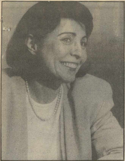
Δαμανάκη: Συγκεντρώνει μεγάλα ποσοστά από οπαδούς όλων των παρατάξεων