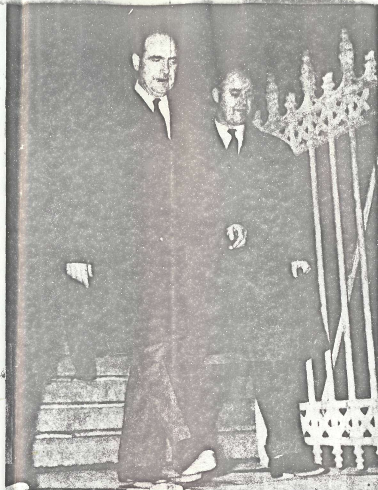
Ο Μένιος Κουτσόγιωργας με τον ΑΝΔΡΕΑ Γ. ΠΑΠΑΝΔΡΕΟΥ έξω από το ανακριτικό γραφείο την εποχή του ΑΣΠΙΔΑ.

Σαν Νομικός Σύμβουλος του Υπουργείου Προεδρίας Κυβερνήσεως και του Υπουργείου Συντονισμού, επί υπουργείας του Ανδρέα Γ. Παπανδρέου, έπεξεργάσθηκε και εισηγήθηκε τις απαραίτητες τροποποιήσεις για την καλύτερη οργάνωση όρισμένων δημοσίων υπηρεσιών. Είναι επίσης ο νομικός εισηγητής των νομοθετικών μέτρων για τον έκδημοκρατισμό των μέσων μαζικής επικοινωνίας και ιδιαίτερα του Τύπου, της ραδιοφωνίας της τηλεόρασεως και της κινηματογραφίας. Εισηγήθηκε επίσης τον τρόπο υλοποιήσεως των συνταγματικών διατάξεων σχετικά με την ελευθερία του συνέρχεσθαι, εκφράζεσθαι