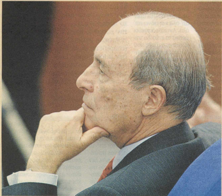
Η φωτογραφία που βλέπετε είναι το μόνο σχόλιο που έχω για την προχθεσινή συνέντευξη του Γιώργου Παπανδρέου...