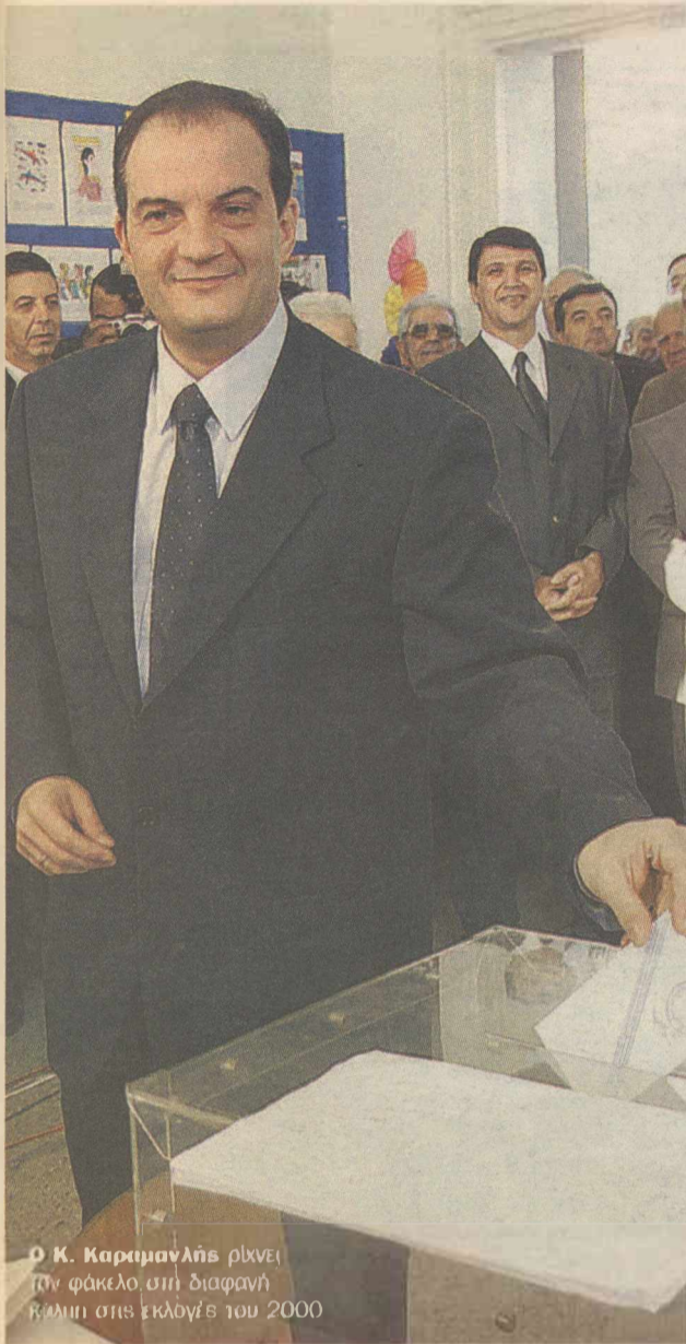
Ο Κ. Καραμανλής ρίχνει τον φάκελο στη διαφανή κλωπή στις εκλογές του 2000

Οι πολιτικές συγκεντρώσεις αποτέλεσαν για μία ακόμη φορά βασικό χαρακτηριστικό της προεκλογικής περιόδου, αλλά αυτή τη φορά σε μικρότερο βαθμό από κάθε άλλη εκλογική αναμέτρηση