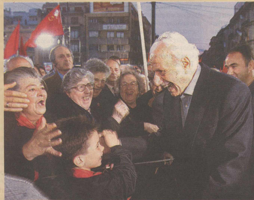
Ο Χ. Φλωράκης συνομιλεί με συγκεντρωμένους στην προεκλογική συγκέντρωση του ΚΚΕ στο Πεδίον του Αρεως, τον Απρίλιο του 2000

Το ΔΗΚΚΙ υποστήριζε ότι η εξωτερική πολιτική της Ελλάδας αποτελείται από τρεις συνιστώσες, συνδεδεμένες μεταξύ τους: την ευρωπαϊκή, τη βαλκανική και τη μεσογειακή. Θεωρούσε δε ότι η εξωτερική πολιτική οφείλει να κινείται με βασικό γνώμονα τα κυριαρχικά δικαιώματα της Ελλάδας στην περιοχή του Αιγαίου, καθώς και τη θετική επίλυση του Κυπριακού.