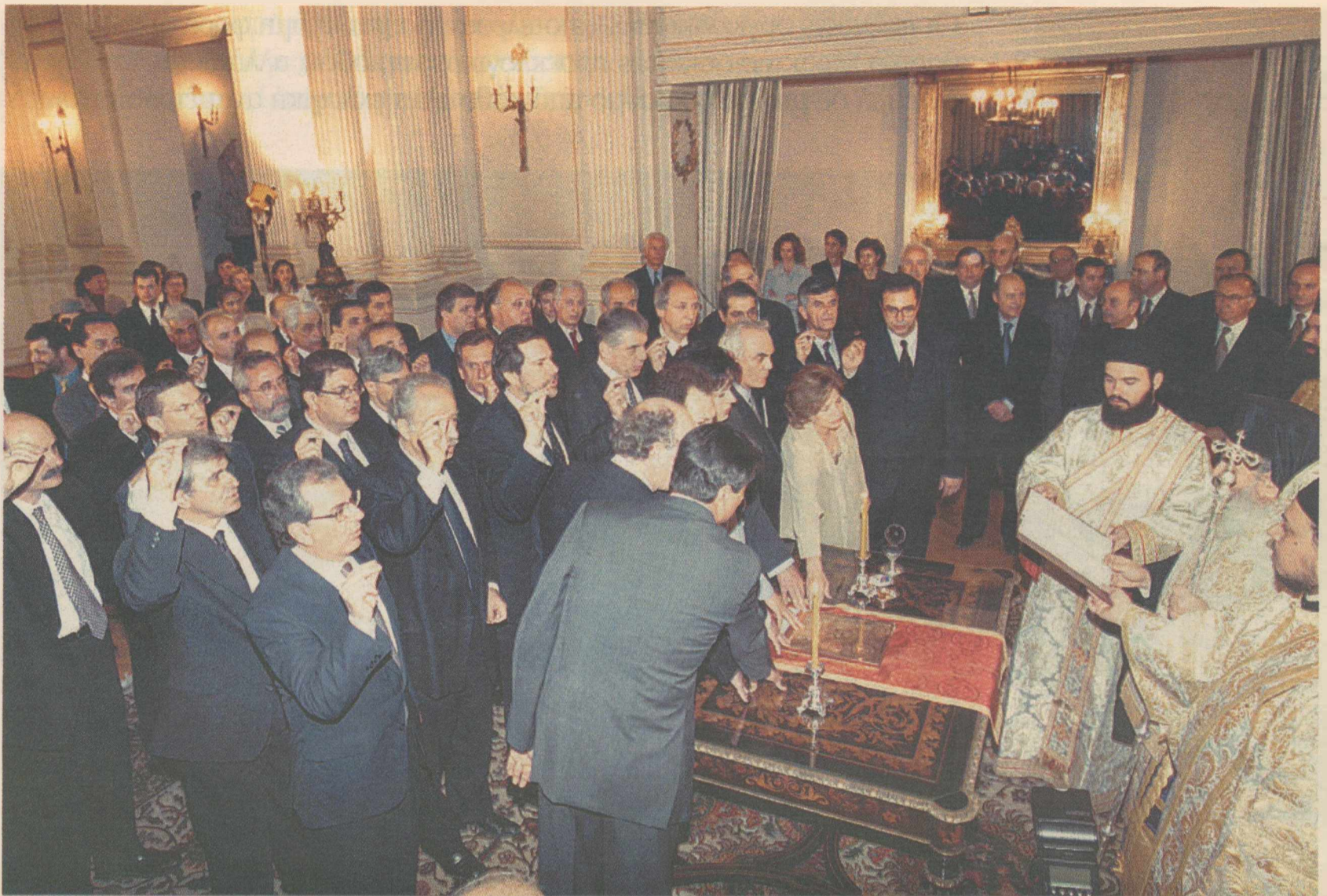
Η ορκωμοσία της νέας κυβέρνησης μετά τη νίκη του ΠΑΣΟΚ στις εκλογές του Απριλίου του 2000