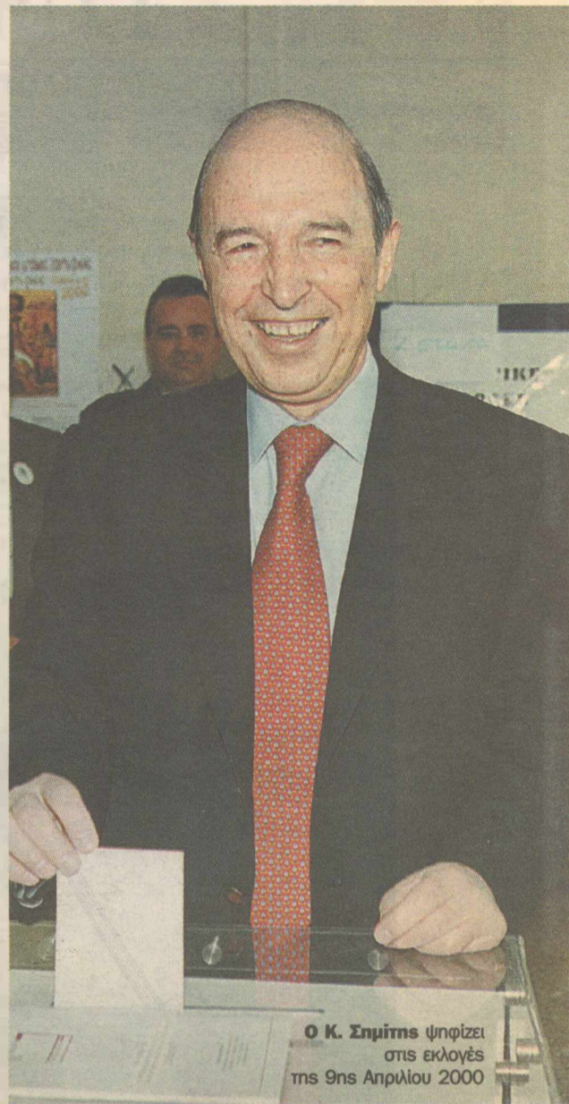
Ο Κ. Σημίτης ψηφίζει στις εκλογές της 9ης Απριλίου 2000