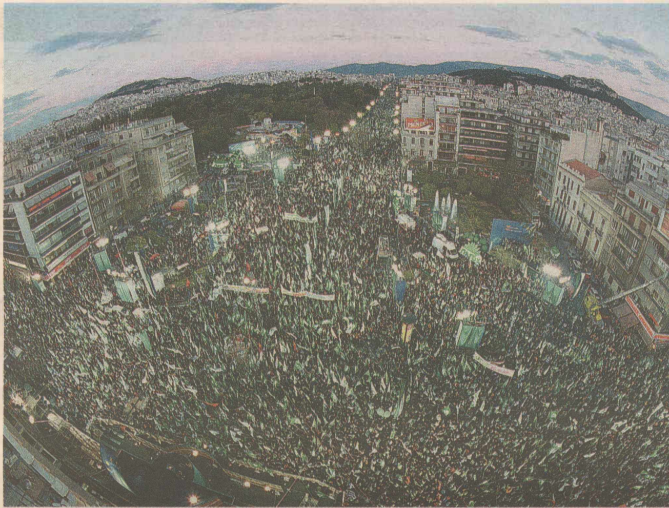
Η προεκλογική συγκέντρωση του ΠαΣοΚ στις 7 Απριλίου του 2000 στο Πεδίον του Αρεως

Κεντρικός άξονας της προεκλογικής στρατηγικής του ΠαΣοΚ ήταν η ταύτιση της ιδέας μιας «σύγχρονης και ισχυρής» Ελλάδας στο εσωτερικό και στο εξωτερικό με το πολιτικό προφίλ του Σημίτη