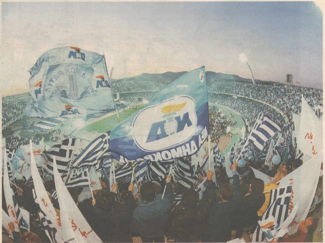
Με συγκέντρωση στο Ολυμπιακό Στάδιο έκλεισε την προεκλογική εκστρατεία της ΝΔ τον Απρίλιο του 2000

θέση να παρουσιάσει ένα πρόγραμμα βασισμένο στην κυβερνητική διαχείριση των εσωτερικών και εξωτερικών θεμάτων. Σίγουρα υπήρξε, όπως είναι φυσικό για κάθε κόμμα που βρίσκεται στην εξουσία, μια κάποια πολιτική φθορά καθώς και κάποιες κρίσεις που είχαν αρνητικές επιπτώσεις για το κυβερνών κόμμα, όπως οι λάθος χειρισμοί στο θέμα Οτσαλάν στις αρχές του 1999. Η αλλαγή αρχηγού όμως το 1996 μετά τον θάνατο του Ανδρέα Παπανδρέου μείωσε σε μεγάλο βαθμό την έκταση αυτής της πολιτικής φθοράς.