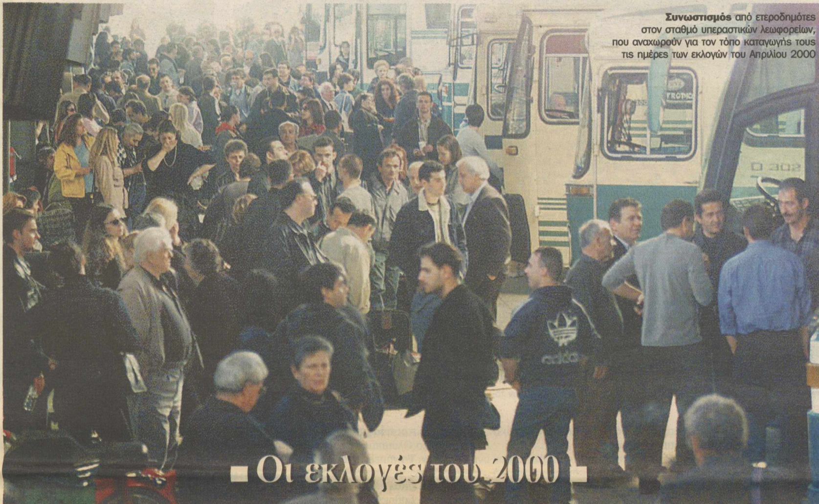
Συνωστισμός από ετεροδημίτες στον σταθμό υπεραστικών λεωφορείων, που αναχωρούν για τον τόπο καταγωγής τους τις ημέρες των εκλογών του Απριλίου 2000

τικής ζωής, θα κατανοήσει τη στρατηγική των πολιτικών αρχηγών και θα ανακαλύψει τις εσωκομματικές έριδες και διαμάχες που προκάλεσαν πολιτικές θύελλες. Το κείμενο συνοδεύεται από πίνακες με τα αποτελέσματα των εκλογών, όπου αναγράφονται τα ποσοστά των κομμάτων, οι ψήφοι που έλαβαν και οι έδρες που εξασφάλισαν στη Βουλή.