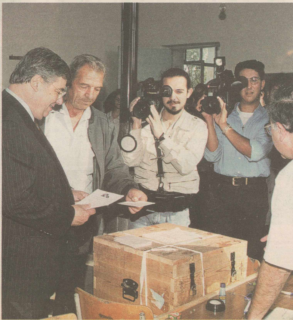
Ο Μ. Εβερτ ασκεί το εκλογικό του δικαίωμα στις εκλογές του 1996

Σημαντικό ρόλο στην αλλαγή της επικοινωνιακής στρατηγικής έπαιξε το γεγονός του πολλαπλασιασμού των τηλεοπτικών καναλιών.