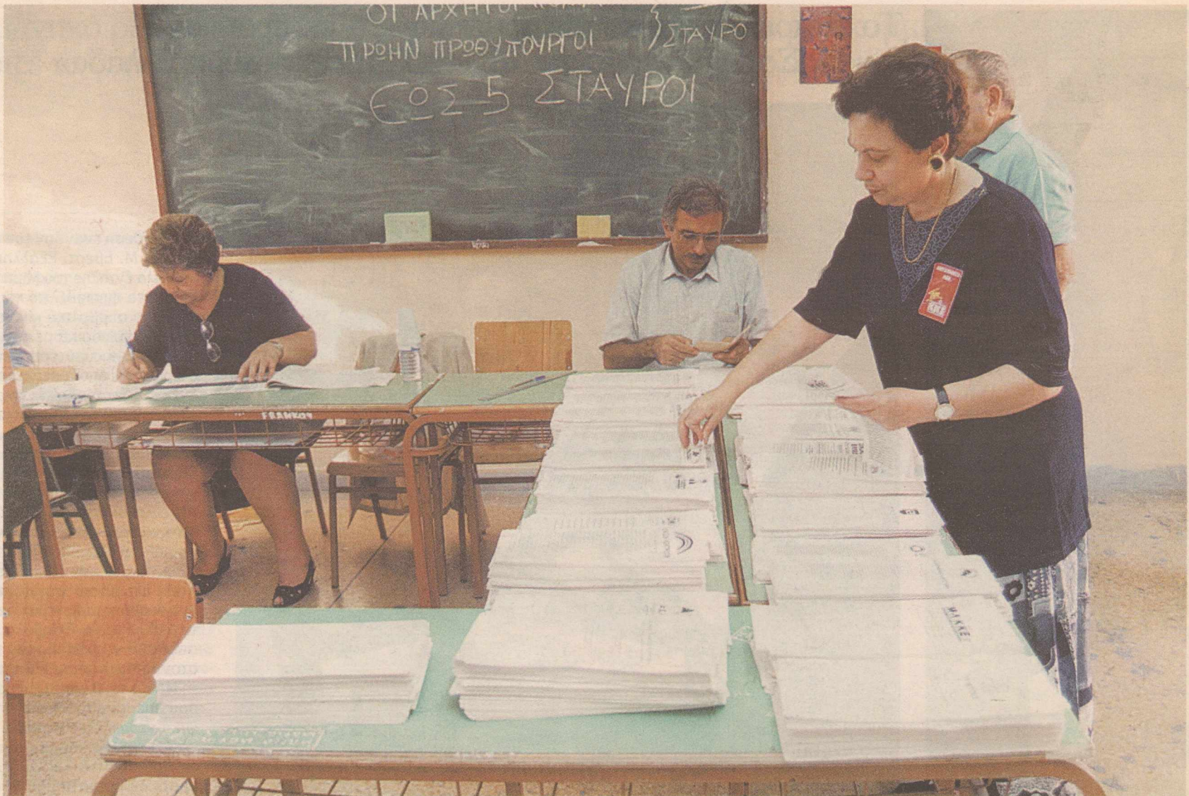
Εκλογικό τμήμα της Αθήνας στις εκλογές της 22ας Σεπτεμβρίου 1996