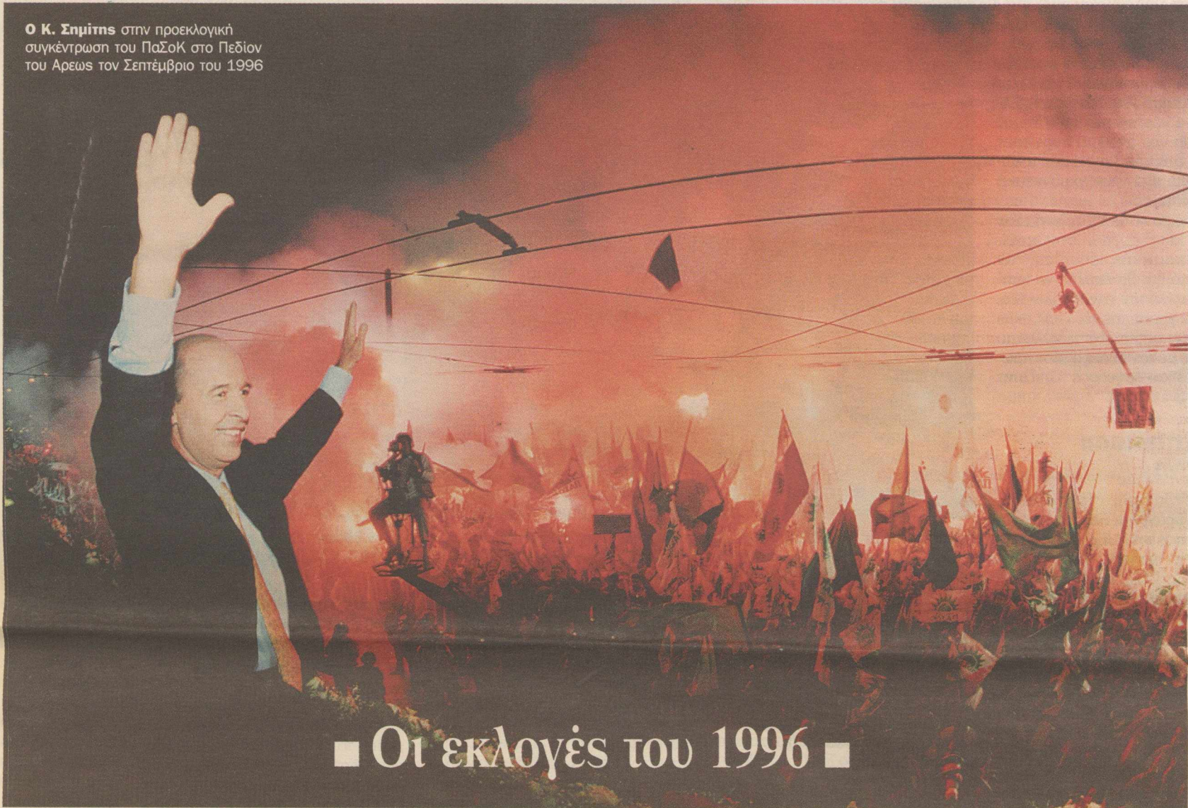
Ο Κ. Σημίτης στην προεκλογική συγκέντρωση του ΠΑΣΟΚ στο Πεδίον του Αρεως τον Σεπτέμβριο του 1996

ζωής, θα κατανοήσει τη στρατηγική των πολιτικών αρχηγών και θα ανακαλύψει τις εσωκομματικές έριδες και διαμάχες που προκάλεσαν πολιτικές θύελλες. Το κείμενο συνοδεύεται από πίνακες με τα αποτελέσματα των εκλογών, όπου αναγράφονται τα ποσοστά των κομμάτων, οι ψήφοι που έλαβαν και οι έδρες που εξασφάλισαν στη Βουλή.