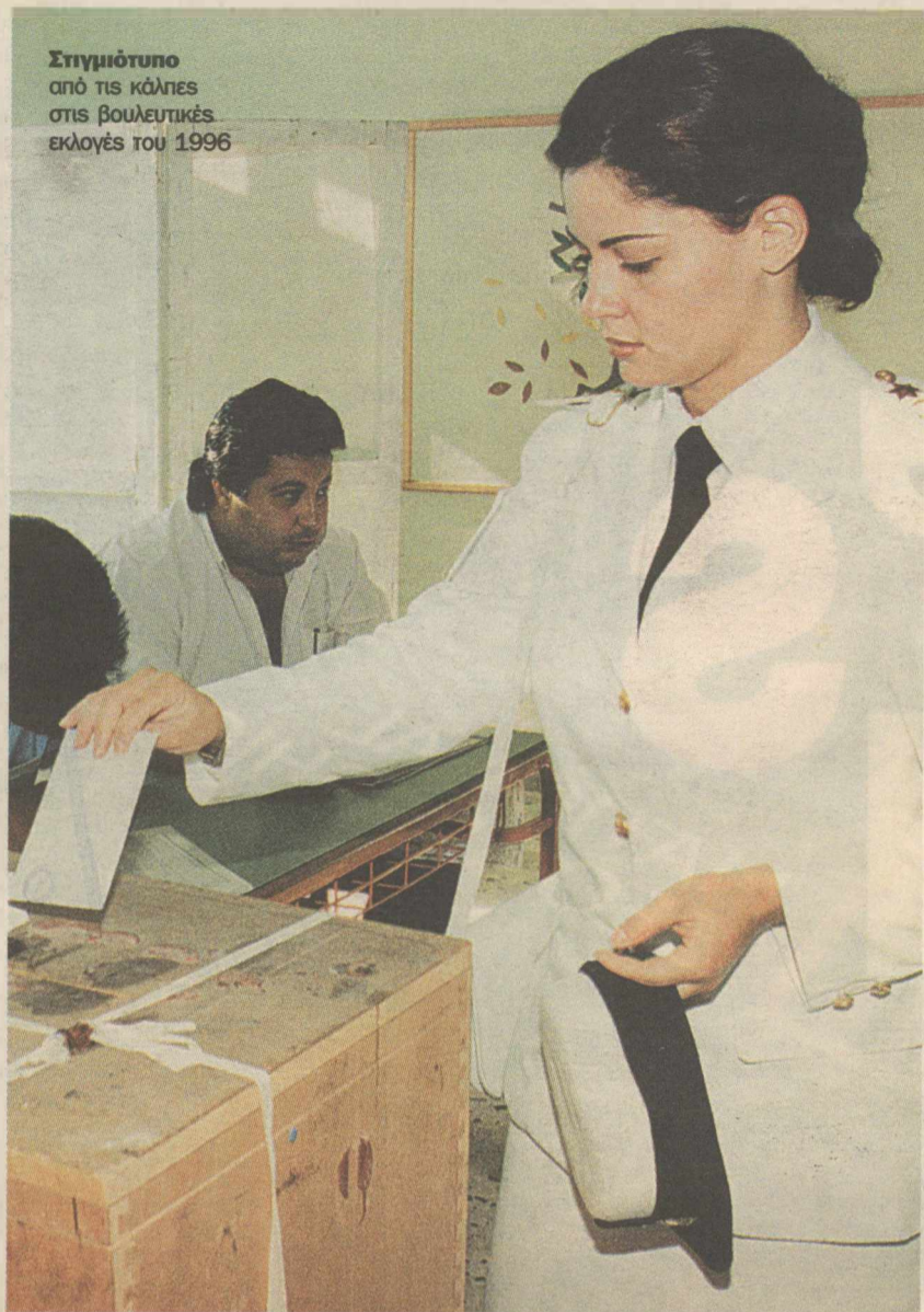
Στιγμιότυπο από τις κάλπες στις βουλευτικές εκλογές του 1996

έγινε υπουργός Εξωτερικών, Τουρισμού και Εθνικής Αμυνας στην οικουμενική κυβέρνηση Ζολώτα, αντιπρόεδρος της κυβέρνησης, αλλά και υπουργός Πολιτισμού και υπουργός Επικρατείας στην κυβέρνηση Μητσοτάκη (1990-1993).