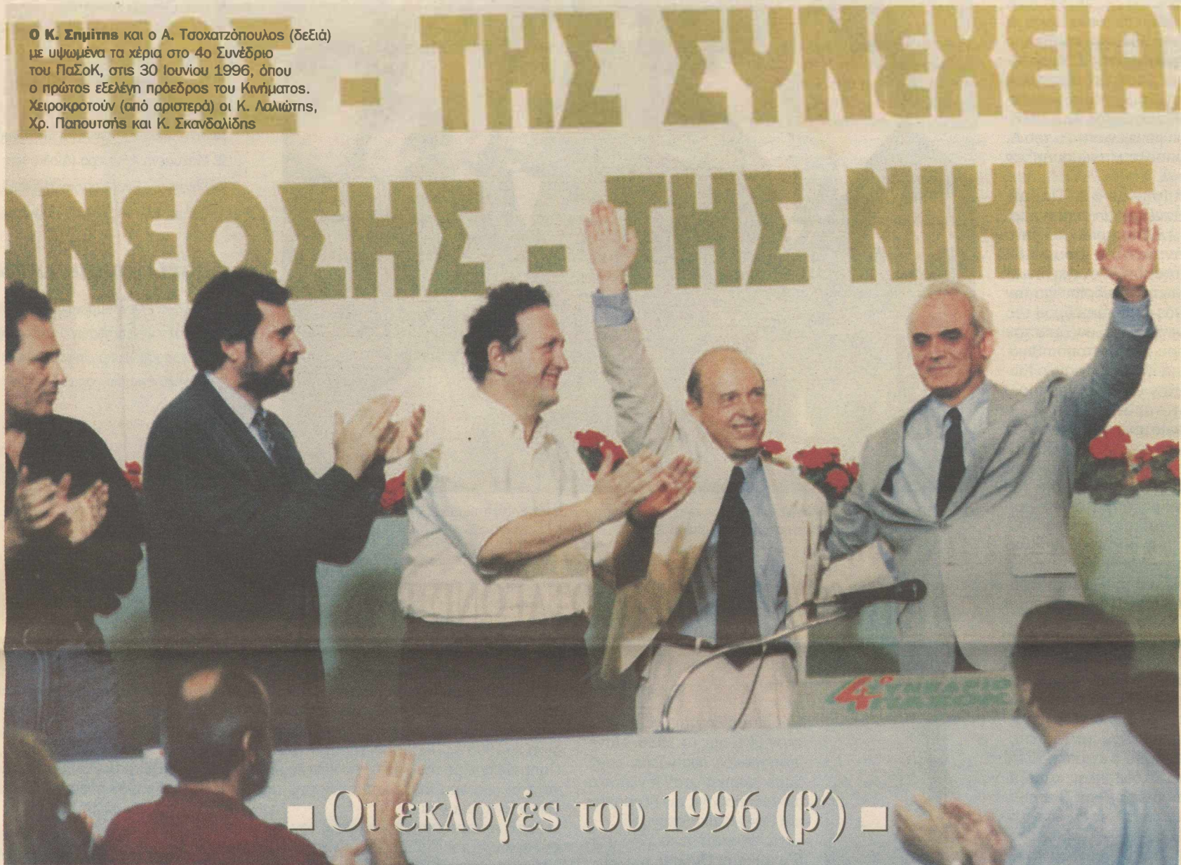
■ Οι εκλογές του 1996 (β') ■

Ο Κ. Σημίτης και ο Α. Τσοχατζόπουλος (δεξιά) με υψωμένα τα χέρια στο 4ο Συνέδριο του ΠαΣοΚ, στις 30 Ιουνίου 1996, όπου ο πρώτος εξελέγη πρόεδρος του Κινήματος. Χειροκροτούν (από αριστερά) οι Κ. Λαλιώτης, Χρ. Παπουτσής και Κ. Σκανδαλιδής