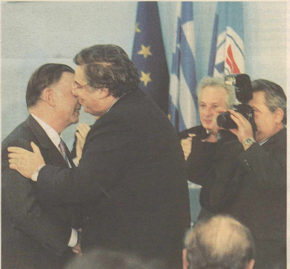
Ο Μ. Εβερτ, μετά την εκλογή του στην ηγεσία της ΝΔ από την Κοινοβουλευτική Ομάδα του κόμματος, ασπάζεται τον Ι. Βαρβιτσιώτη στις 3 Νοεμβρίου 1993

Η δεύτερη διαφορά μεταξύ των εκλογών του 1996 και εκείνων του 1993 ήταν η διεξαγωγή τους με βάση την απογραφή του 1991. Αυτό είχε αποτέλεσμα τις αλλαγές των βουλευτικών εδρών σε 13 εκλογικές περιφέρειες.