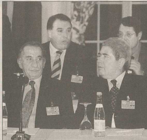
« Το Σχέδιο Ανάν όπως διαμορφώθηκε στη Λουκέρνη, περιείχε πρόσθετες διατυπώσεις, που ανταποκρίνονταν στα αιτήματα της ελληνοκυπριακής ηγεσίας. Η ηγεσία της Κύπρου θεώρησε όμως το αποτέλεσμα της διαπραγμάτευσης αρνητικό », γράφει στο βιβλίο του ο κ. Κ. Σημίτης».

(...) Και το Σχέδιο Ανάν όπως διαμορφώθηκε στη Λουκέρνη, περιείχε πρόσθετες διατυπώσεις, που ανταποκρίνονταν στα αιτήματα της ελληνοκυπριακής ηγεσίας. Η ηγεσία της Κύπρου θεώρησε όμως το αποτέλεσμα της διαπραγμάτευσης αρνητικό και άφησε την τουρκική πλευρά να κάνει αυτό για το οποίο ήταν ούτως ή άλλως αποφασισμένη, να θριαμβολογήσει γι' αυτό που δήθεν πέτυχε».