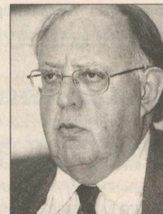
Ο Θεόδωρος Πάγκαλος.