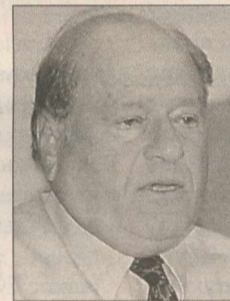
Ο Γεράσιμος Αρσένης.