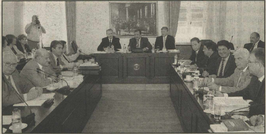
Στην τελική ευθεία εισέρχονται οι εργασίες της Εξεταστικής Επιτροπής της Βουλής για τα εξοπλιστικά

Μετά τις γιορτές των Χριστουγέννων (με πιθανότερη την εβδομάδα 10 με 14 Ιανουαρίου) αναμένεται να εκδοθεί το πόρισμα της Εξεταστικής Επιτροπής για τα εξοπλιστικά, οι εργασίες της οποίας από σήμερα μπαίνουν στην τελική ευθεία.