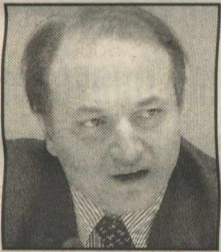
Του Φώτη Παπαθανασίου

Με τη γαλλική γλώσσα μας συνδέουν ειδικοί δεσμοί: τα γαλλικά, σύμφωνα με μελέτη του ίδιου του γαλλικού υπουργείου Παιδείας, περιέχουν λέξεις ελληνικής ρίζας σε ποσοστό 64%! Μοιάζει απίστευτο, είναι όμως αληθινό και οφείλεται στο ότι τα λατινικά αποτελούνται κατά το πλείστον από ελληνικές λέξεις. Την αίτηση εισδοχής υπέγραψε ο Κ. Σημίτης λίγο πριν από τις τελευταίες εκλογές, έπειτα από εισήγηση του Γ. Παπανδρέου, τότε υπ. Εξωτερικών.