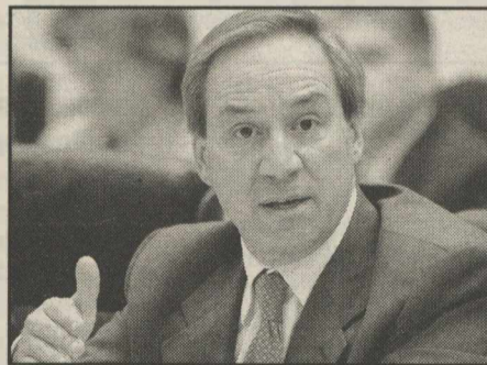
Οικονομικά αιτήματα της Αυτοδιοίκησης θα μεταφέρει στον υπουργό Εθνικής Οικονομίας η ΚΕΔΚΕ

Από αυτά, ποσό 267 εκατ. ευρώ αφορά τη χρηματοδότηση των μεταφερθεισών και μεταφερομένων αρμοδιοτήτων στους ΟΤΑ, ενώ ποσό 141 εκατ. ευρώ αφορά τη νομοθετημένη εισφορά των υπουργείων για το πρόγραμμα της Τοπικής Αυτοδιοίκησης «ΘΗΣΕΑΣ», το οποίο συγχρηματοδοτείται από την Τοπική Αυτοδιοίκηση και από την εισφορά των