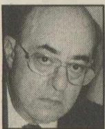
Του Μιχάλη Δημητρίου

Με καλές ελπίδες εγκαινιάστηκαν οι «εξετάσεις» των υπουργών στο Μαξίμου, προκειμένου να μη γίνει απλώς μια βαθμολογία για την έως τώρα δράση και απόδοση των υπουργών της κυβέρνησης από τον πρωθυπουργό. Σκοπός αυτών των συνεργασιών είναι επίσης να επιταχυνθεί το κυβερνητικό έργο σε τομείς, κρίσιμους τομείς της καθημερινότητας,