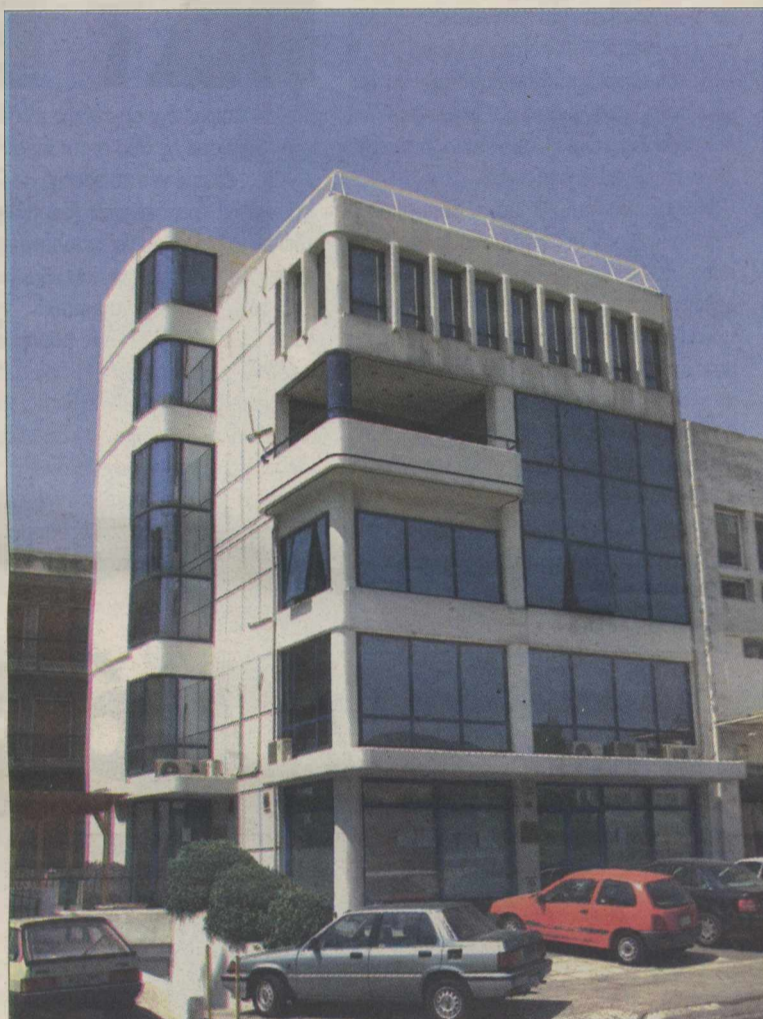
Σύμφωνα με την έρευνα του ΣΕΕΔΔ την οποία παρουσίασε χθες ο κ. Γεωργακόπουλος διαπιστώθηκε, μεγάλη δυσλειτουργία του εν λόγω κέντρου και φαινόμενα κακοδιοίκησης

Πάντως σύμφωνα με την έκθεση ο μέσος όρος για αναγνώριση τίτλων σπουδών από ΑΕΙ σε χώρες Ευρωπαϊκής Ένωσης χωρίς εξετάσεις ανέρχεται σε 2 μήνες για τίτλους Ιατρικής και σε 5 για τίτλους οδοντιατρικής. Αντίστοιχα για αναγνώριση τίτλων ΑΕΙ εκτός Ευρωπαϊκής Ένωσης με εξετάσεις ο χρόνος ανέρχεται σε τίτλο Ιατρικής σε 4,5 μήνες και σε τίτλους οδοντιατρικής 9 μήνες. Για τους μεταπτυχιακούς τίτλους ο χρόνος ανέρχεται σε 6 μήνες, κατά μέσο όρο και 5,5 μήνες για διδακτορικούς τίτλους.