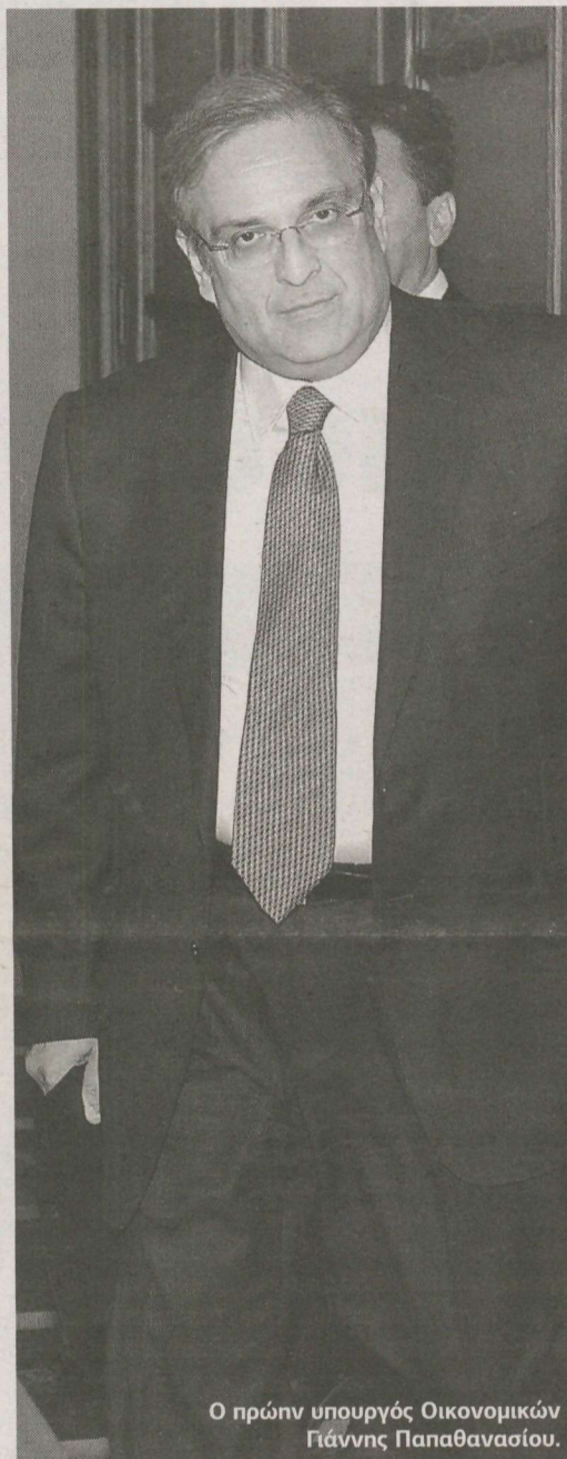
Ο πρώην υπουργός Οικονομικών Γιάννης Παπαθανασίου.

Στις 20 σελίδες του υπομνήματός του, ο κ. Γιάννης Παπαθανασίου «αποφλοιώνει» σημείο προς σημείο τους περίτεχνα συρραμμένους πράσινους μύθους που καλλιέργησε η κυβέρνηση του Γιώργου Παπανδρέου επί δύο ολόκληρα χρόνια καταδεικνύοντας στο διά ταύτα πως ενώ «η κυβέρνηση του ΠΑΣΟΚ μπορούσε να συγκρατήσει το έλλειμμα του 2009 σε μονοψήφιο ποσοστό», ο υπουργός Οικονομικών του ΠΑΣΟΚ «όχι μόνο δεν φρόντισε να λάβει άμεσα μέτρα, αλλά αντίθετα φρόντισε να συκοφαντήσει και να διασύρει τη χώρα του διεθνώς. Οι προσωπικές ευθύνες του κ. Παπακωνσταντίνου είναι τεράστιες και αυταπόδεικτες και ο φάκελος με το ποιο και γιατί οδήγησαν την Ελλάδα στη μέγκελη του ΔΝΤ πρέπει να οφείλει να ανοίξει». ■