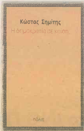
Η πρόταση Σημίτη για τους θεσμούς στο νέο βιβλίο του