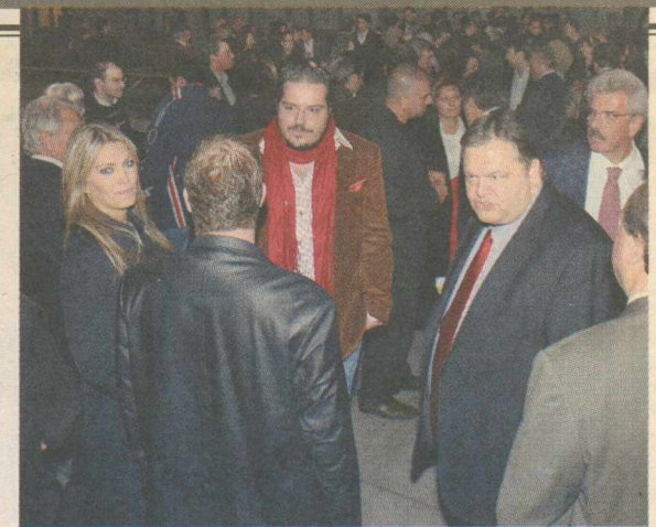
Ο ΦΑΝ της φωτογραφίας πέτυχε την εκσυγχρονιστική υπέρβαση φορώντας φουλάρι παλιού Κνίτη, μαντιλάκι φέρελι Δαπίτη, συνδυασμένο με αεζύριστο μούσι παλιού αναθεωρητή του κομμουνισμού (και νυν συνασπισμένου), μαζί με καφέ σουέτ αλλοτινού «πρασινοφρουρού»