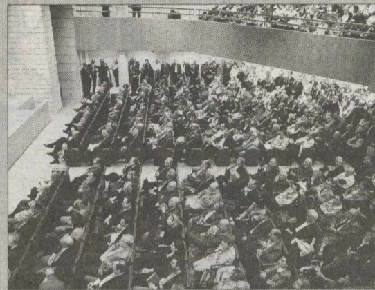
Κατάμεστη η αίθουσα όπου ο Κ. Σημίτης παρουσίασε το νέο του βιβλίο, «Η Κρίση». Δεξιά, ο πρώην πρωθυπουργός με τον Ευ. Βενιζέλο