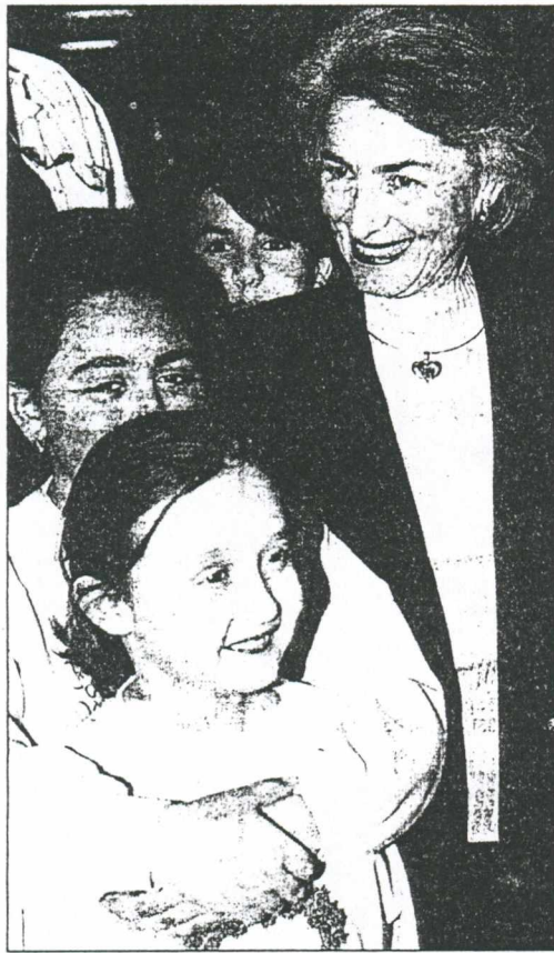
Η σύζυγος του πρωθυπουργού αφού γαϊρέθηκε τα παιδιά έφυγε ικανοποιημένη από το Νοσοκομείο Νίκαιας, αφού όπως δήλωσε: "Οι κουνούργιοι χώροι είναι θαυμάσιοι και οι παλίοι είναι καθαροί και περιποιημένοι, ενώ το προσωπικό είναι πολύ ανθρώπινο".