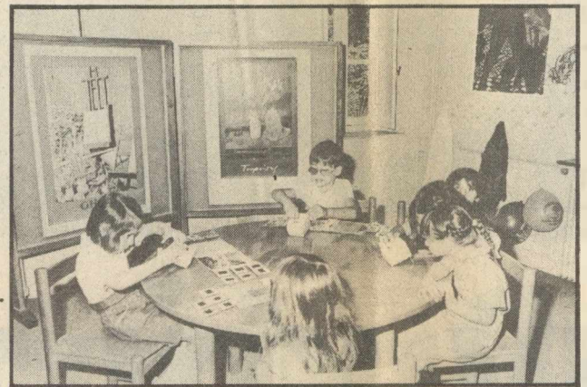
Αίθουσα της παιδικής βιβλιοθήκης, σε κτίριο του Κήπου

Ακόμα ο κ. υπουργός επισκέφτηκε τη βιβλιοθήκη του Εθνικού