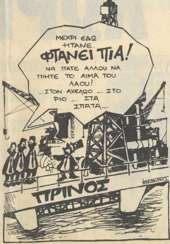
(Του Μ. Κουντούρη)