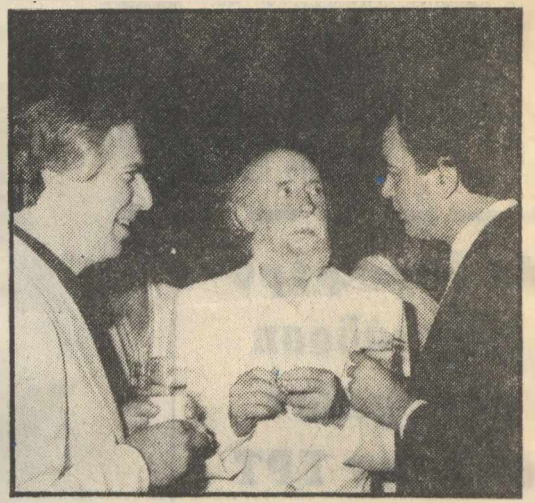
Ο Γ. Τσαρούχης, ο κ. Δημ. Πιερίδης (αριστερά) και ο σκηνοθέτης Γ. Μεσσάλας