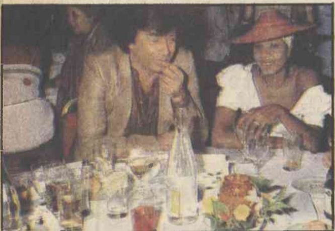
Ο ηθοποιός Κώστας Καρράς πολύ κεφάτος με μαύρη καλλονή στο πλάι του.