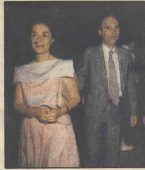
Ο ύπουργός Γεωργίας και η κυρία Κώστα Σημίτη προσέρχονται στην δεξίωση της Γαλλικής πρεσβείας.