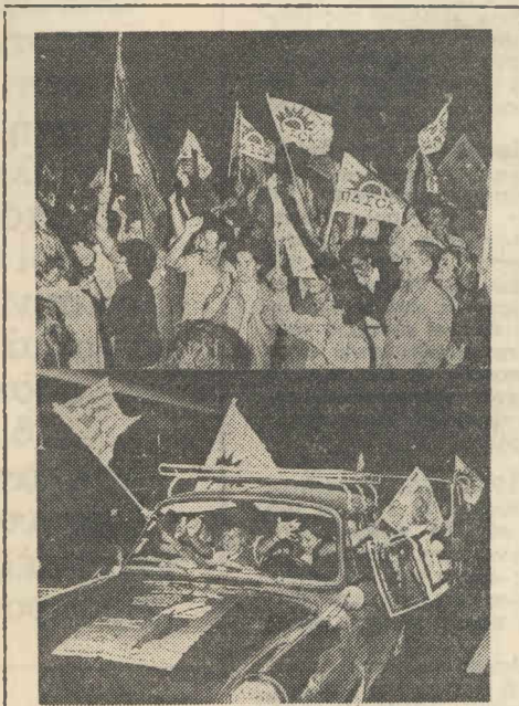
Πανηγυρισμοί στους δρόμους της Αθήνας. Αρχίζει ή πρώτη μέρα της Αλλαγής.

Ό κ. Άδέρωφ διαφεύγει πως άποκαθήλωσε τις φωτογραφίες του κ. Ράλλη από τους τοίχους της Ρηγίλλης. Στην (άκρω) πολιτικοποιημένη άποκρία που αρχίζει ή λέξη «κλαδική» θα γνωρίσει ίσως πιέννες με τους «πρασινοφρουρούς».