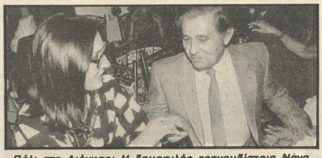
Πάλι στο Διόνυσο: Η δημοφιλής τραγουδίστρια Νάνα Μούσχουρη μ' ένα δημοφιλή υπουργό, τον κ. Απ. Λάζαρη, που δεν άκουσα άνθρωπο να μην παραδεχτεί τη σεμνότητα και τη σωφροσύνη του