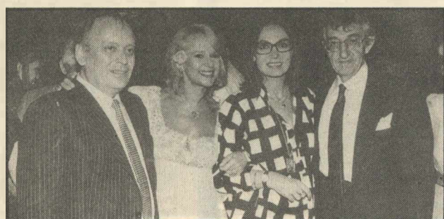
Στο Διόνυσο: Διο εθνικές σταρ. Η Μούσχουρη και η Βουγιουκλάκη με τον πρόεδρο του ΕΟΤ κ. Κ. Κυριαζή και το διευθυντή του Φεστιβάλ Αθηνών Ξενοφώντα Σπύρου

Μ ΕΤΑ την πρεμιέρα, ο τουρισμός και η Μούσχουρη δέχτηκαν κόσμο στο «Διόνυσο» για τη δεξίωση προς τιμήν της. Η Νάνα φορούσε ένα απλό φόρεμα που της πήγαινε πολύ, αντίθετα απ' αυτά με τα οποία εμφανίστηκε στις συναυλίες. Στη δεύτερη εμφάνισή της, η Νάνα είχε χάσει το τρακ της και ο θρίαμβος συνεχίστηκε.