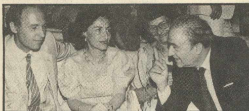
Αριστερή φωτογραφία: Ο υπουργός Γεωργιάς και η κ. Σημίτη κουβεντιάζουν με τη νομάρχη Αττικής κ. Κατριβάνο. Δεξιά: Ο βουλευτής της Ν.Δ. και η κ. Μιλτ. Εβερτ