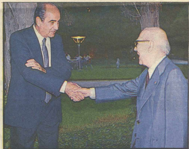
Εγκάρδια χειραψία μεταξύ του προέδρου της Ν.Δ. κ. Μητσοτάκη και του πρώην Προέδρου της Δημοκρατίας κ. Στασινόπουλου.

Η κ. Μάρκαρετ Παπανδρέου με... καινούριο πρόσωπο, αλλά