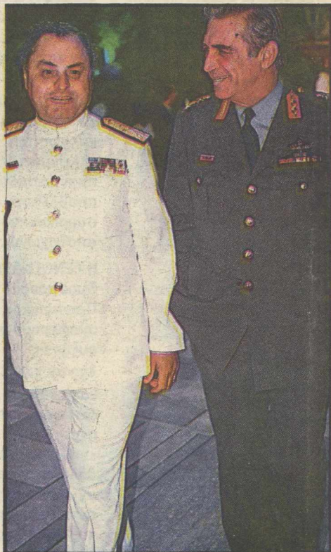
Ο ναύαρχος κ. Νίκος Παππάς με επιτελή του Γ.Ε.Σ.

ΜΙΛΗΣΑΜΕ χθες για τη «διψα» των «στημένων» καλεσμένων, από τον αμφιτρυόνα, πρώτο πολίτη της χώρας στη δεξίωση που έδωσε στους κήπους του Προεδρικού Μεγάρου για την επέτειο της «Αποκατάστασης της Δημοκρατίας».