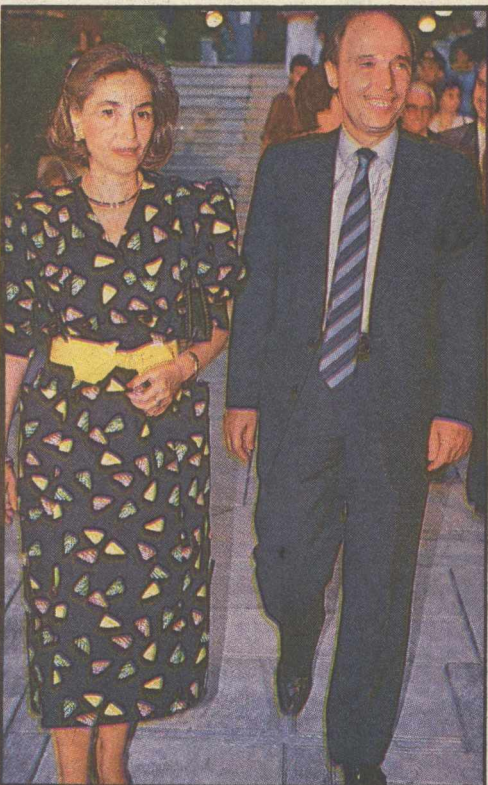
Ο υπουργός Εθνικής Οικονομίας και η κ. Σημίτη.