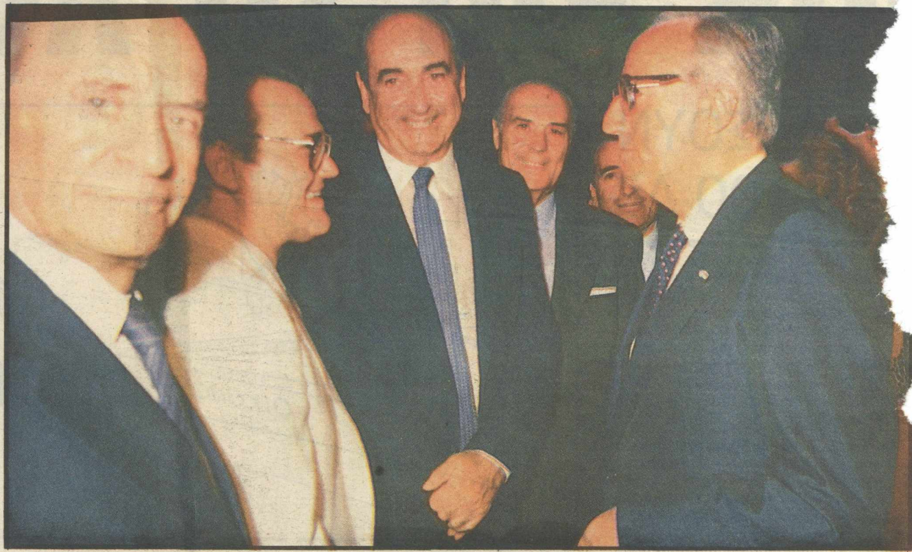
Ο Πρόεδρος της Δημοκρατίας, ο πρόεδρος της Νέας Δημοκρατίας κ. Μητσοτάκης, οι βουλευτές κ.κ. Ταλιαδούρος και Κράτσας στη δεξίωση για την αποκατάσταση της Δημοκρατίας.