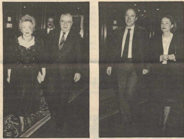
Ο πρόεδρος της Βουλής κ. Γιάννης Αλευράς και η σύζυγός του Χριστίνα, προσέρχονται στη γιορτή των «Εικόνων». Στο βάθος ο υφυπουργός Παιδείας κ. Πέτρος Μώραλης. Δεξιά: Ο υφυπουργός Εθνικής Οικονομίας κ. Κώστας Σημίτης με τη σύζυγό του. Στη «λίστα» της βραδιάς υπήρχε και το όνομα Μαρούδας. Μόνο που επρόκειτο για τον ανεξάντλητο τροβαδούρο Τόνυ Μαρούδα. Εφταν όμως για να γίνει το καλαμπόρι που έβγαλε αυθόρμητο γέλιο. Τ.Κ.

ΣΤΟ προχθεσινό γκαλά των «Εικόνων» για την απονομή των τηλεοπτικών βραβείων: Στο ίδιο τραπέζι με Σημίτη, Μώραλη, Μαρούδα και Πέτσο, γίνεται μίνι συζήτηση για ανασχηματισμούς, λίστες κ.λπ. Κάποια στιγμή η κουβέντα γυρίζει στο καλλιτεχνικό πρόγραμμα της βραδιάς, καθώς στα χέρια μου κρατώ μια άλλη λίστα, αυτή με τους καλλιτέχνες που θα εμφανίζονταν. Την κοιτάει ο υπουργός Εθνικής Οικονομίας, την κοιτάει ο υφυπουργός Παιδείας, την κοιτάει και ο τέως υφυπουργός Τύπου. Ο Γιώργος Πέτσος, καθισμένος στην άκρη, δεν έχει αντιληφθεί τη μετάταξη της συζήτησης από τα πολιτικά στα καλλιτεχνικά. Βλέπει και τη «λίστα» και ζητάει να δει τα ονόματα. — Δεν είναι τίποτα σίγουρο. Πληροφορίες του Τέρενς γραμμένες σ' ένα χαρτί, του λέει ο Δημήτρης Μαρούδας, δίνοντας τη «λίστα». Διαβάζει ο Γιώργος, αντιλαμβάνεται την πλάκα που του κάνει ο συνάδελφός του βουλευτής και του την αντιστρέφει: — Εγώ ένα πράγμα κατάλαβα, Δημήτρη μου. Σε ό,τι είδους λίστα κυκλοφορεί, το δικό σου όνομα είναι... πάντα μέσα! Φαίνεται ότι είσαι ο πιο σίγουρος!