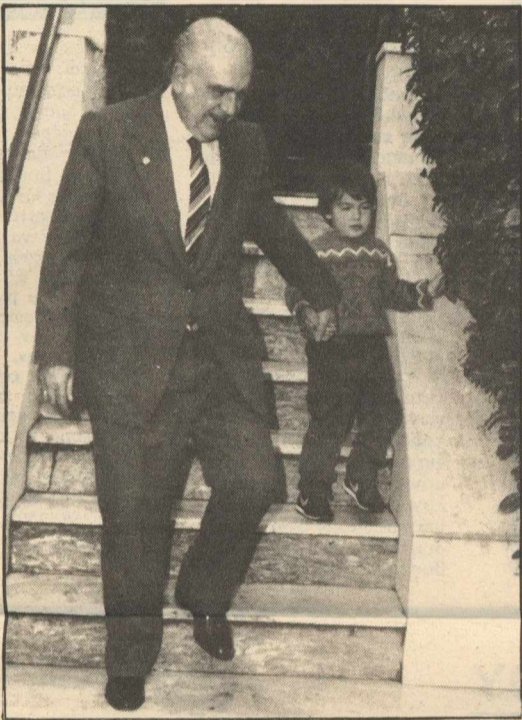
ΟΤΑΝ η εξουσία εξουσιάζεται από τα παιδιά. Προφανώς πρόκειται για αλληγορία. Στη φωτογραφία ο πρωθυπουργός κ. Α. Παπανδρέου με τον «Αντρέα τζούνιορ», γιο του Θ. Κατσάνεβα και της Σοφίας Παπανδρέου, χτες στα σκαλοπάτια της έπαυλης «Γαλήνη». Μια ανάπαυλα από τις βαρύτατες ευθύνες και αναστολές που απαιτεί η εξουσία.

★ ΤΟ θέμα της επίσκεψης του Γ. Α. Παπανδρέου στις Η.Π.Α. και των συνομιλιών του εκεί, επανήλθε για μια ακόμα φορά χτες στο πρεσ. ρουμ. Αφορμή, η ερώτηση δημοσιογράφου προς τον Κυβερνητικό Εκπρόσωπο, αν ο υφυπουργός γιος του Πρωθυπουργού είναι εξουσιοδοτημένος να ενημερώνει για εθνικά θέματα τους συνομιλητές του. Η απάντηση: «Ο απόδημος Ελληνισμός είναι μέσα στα εθνικά θέματα και παίζει καθοριστικό ρόλο σ' αυτά». — Μήπως είστε έτοιμος να μας απαντήσετε σήμερα αν θα συναντηθεί και με τον αρχιεπίσκοπο κ. Γαβριήλ; ● «Μέχρι στιγμής δεν υπάρχει τίποτα. Αν πραγματοποιηθεί η συνάντησης θα σας ενημερώσουμε».