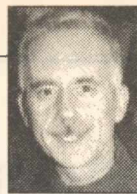
Γράφει ο Μάρκος Μουζάτης

Άθλια και επικίνδυνη η επιχείρηση παραχάραξης της ιστορίας