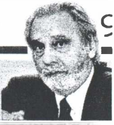
ΓΡΑΦΕΙ Ο ΚΩΝΣΤΑΝΤΙΝΟΣ ΤΣΟΥΚΑΛΑΣ