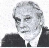
ΤΟΥ ΚΩΝΣΤΑΝΤΙΝΟΥ ΤΣΟΥΚΑΛΑ

Τ ο γεγονός ότι ένας άνθρωπος που γηθήκε μιας χώρας για οκτώ συναπτά χρόνια καταθέτει ενυπογράφως έναν λεπτομερή και σε πολλά σημεία εξονυχιστικό πολιτικό απολογισμό της διακυβέρνησής του δεν είναι ασφαλώς συνηθισμένο. Οπως εξίσου πρωτόφαντη, τουλάχιστον για τα ελληνικά δεδομένα, είναι η επιλογή μιας εν γένει πολιτικής προσωπικότητας να μιλήσει για το μέλλον στο όνομα ενός παρελθόντος για το οποίο αναλαμβάνει και την πολιτική ευθύνη. Θα περίμενε λοιπόν κανείς ότι οι «αντιδράσεις» στο βιβλίο αυτό θα ήταν εξίσου ιστορικά και πολιτικά υπεύθυνες και ενυπογράφες.