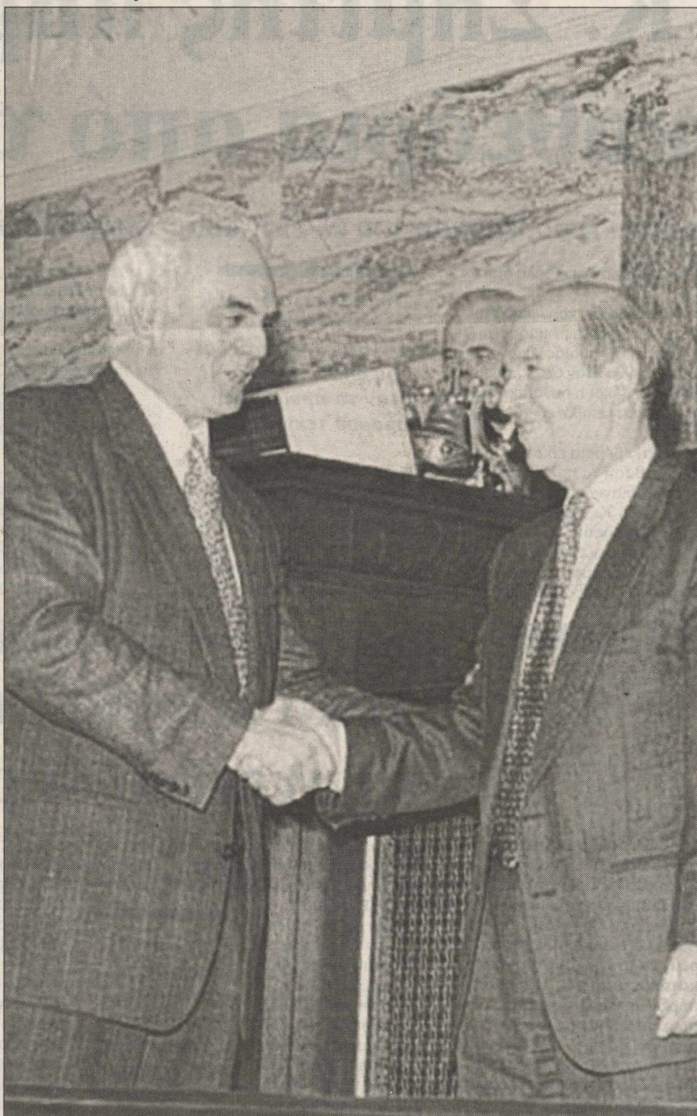
Η ιστορική στιγμή. Ο πτηνένος της ψηφοφορίας στην Κοινοβουλευτική Ομάδα του ΠΑΣΟΚ Ακης Τσοχατζόπουλος συχαίρει το νικητή Κώστα Σημίτη. Από τον Ιανουάριο του 1996 άρχισε η πολιτική ηγεμονία του σημερινού πρωθυπουργού.

Η «Ε» παρουσιάζει από σήμερα μία έρευνα σε βάθος για το πολιτικό «φαι-