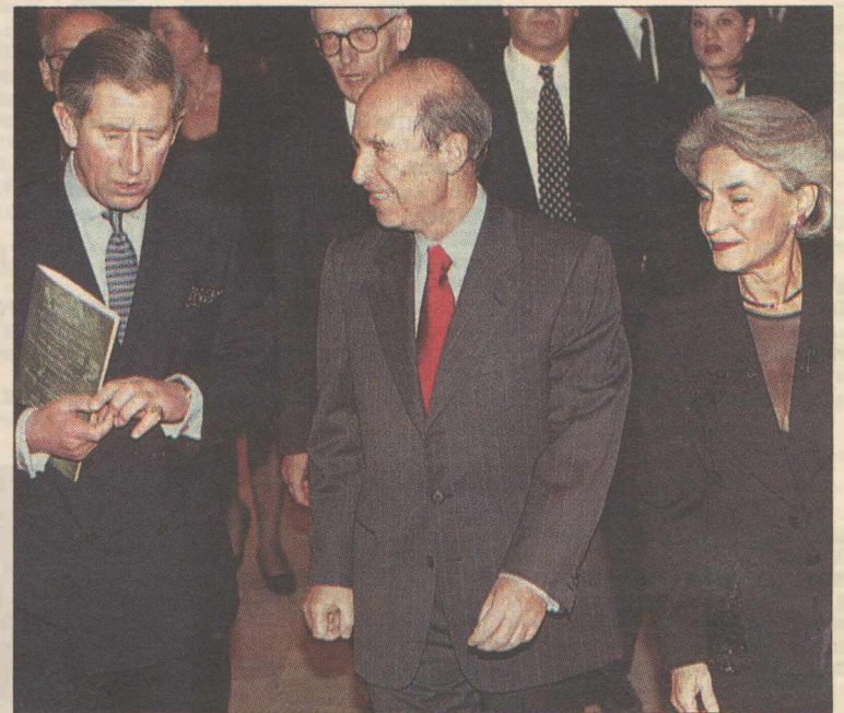
Ο πρίγκιπας Κάρολος με τον πρωθυπουργό Κώστα Σημίτη και τη σύζυγό του Δάφνη χθες βράδυ στο Μέγαρο Μουσικής

Στη συνέχεια, ο πρίγκιπας της Ουαλίας ξεναγήθηκε από τον κ. Λαμπράκη στην έκθεση «Ζωγραφική για το θέατρο» που παρουσιάζεται στο ισόγειο του Μεγάρου. Εκεί παρατήρησε τις ακουαρέλες - μια άλλη αδυναμία του διαδόχου του αγγλικού θρόνου - του Νίκου Χατζηκυριάκου-Γκίκα για τα σκηνικά του χοροδράματος «Περσεφόνη», που είχε ανέβει στο Κόβεν Γκάρντεν. Στο τέλος της ξεναγήσης ο πρίγκιπας Κάρολος υποδέχθηκε τον πρωθυπουργό κ. Κώστα Σημίτη για να παρακολουθήσουν από το «θεωρείο β» της Αίθουσας Φίλων της Μουσικής τη συναυλία της Ακαδημίας του Αγίου Μαρτίνου των Αγρών που διηύθυνε ο σερ Νέβιλ Μάρνερ και η οποία άρχισε με την ανάκρουση των Εθνικών Ύμνων των δύο χωρών. Και όταν τελείωσε το πρώτο μέρος της συναυλίας με την εκτέλε-