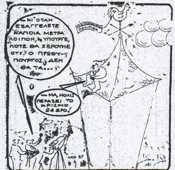
Καθημερινή 29/11/87 (Σχίση του Κ.—)

ήλ κ... του 15... πίσκει... υπουργ... Π. Ρο... Νοέμβ... Στή... του στ... δος σ... κάν α... Προέδ... Λευρά... το Ισρ... μηνών... κ. Με)... «Η... λου Ε... ως τώ... τελεί... προηγ... ται με... Ισραή... φιλίας... τίον ο... σχετικ... ο πρέσ... Γκιλμ... Κ