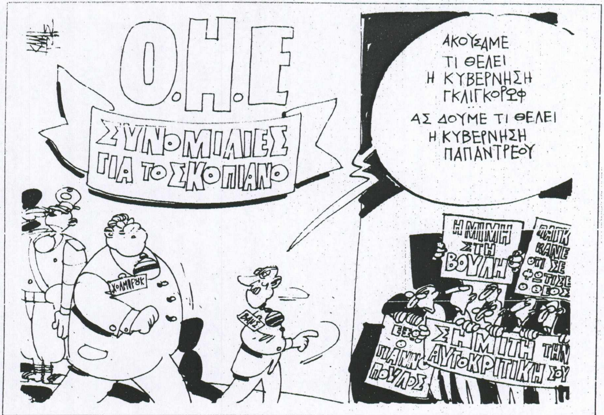
Του ΓΙΑΝΝΗ ΚΑΛΑΪΤΖΗ

Κ. ΤΕΓΟΠΟΥΛΟΣ Α.Ε. Σ.: ΧΡ. ΤΕΓΟΠΟΥΛΟΣ ΝΑΣΗΣ ΤΕΓΟΠΟΥΛΟΣ ΡΑΦΕΙΜ ΦΥΝΤΑΝΙΔΗΣ ΣΤΑΥΡΟΣ Φ. ΑΠΕΡΓΗΣ Π. ΠΑΡΑΣΚΕΥΟΠΟΥΛΟΣ Β. ΠΑΝΑΓΟΠΟΥΛΟΣ ιάτων: Π. ΔΙΑΜΑΝΤΗΣ, ΥΛΟΣ, Σ. ΠΟΥΛΜΙΑΝΣ ντάς: Γ. ΤΣΙΒΕΡΙΩΤΗΣ Α.Ε. 16, 117 43 ΑΘΗΝΑ Α. 9296001 Ε: 9028311-12-13 216879-218736 ΔΟΣ: Τσισοκή & Κούσκουρα 7