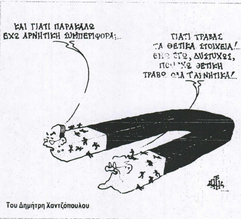
Του Δημήτρη Χαντζόπουλου

ΤΟ ΕΔΩΣΕ κομπο ο δουλευτής... (από τον...)