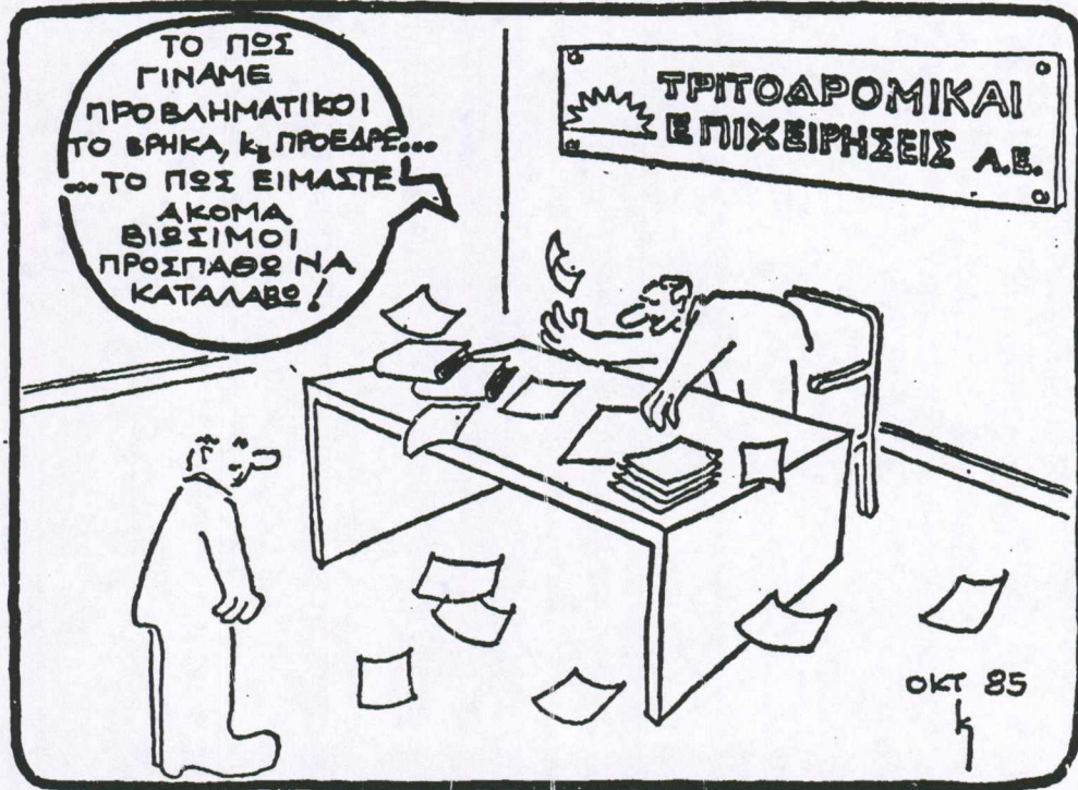
20-21 Οκτωβρίου '85 (Σμίτσο του «Κ»)

ελληνικού λαού ονομίας. Ο τρέπολιτική εναιχχει τήν γνώση ημια της οικονομίας της χώρας. ησως της χώρας σε περίοδο μόης των σοσιωγος. Πέντε μήξε ποτέ η νίκη ρια ο πασοκικός