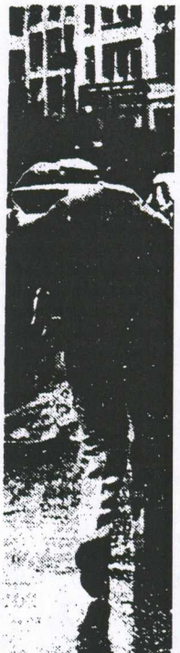
Η φωτογραφία, που γάλης μερίδας τών θερονητικά μέτρα. «Α πρώτης ανάγκης ειδ εμπιστοσύνης στή