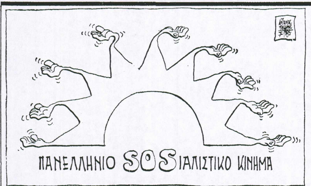
(Τού Αντώνη Πάουση)

... που υθούν σε α... αντιπαράθεση, πέν... μετά τήν ετυμηγο... κού λαού. Απλάσ... πραγματικά δεδο... κής ζωής, οι παρα... και εκτιμώντας σω... σεις τού λαού, πι... ραγδαία μετεξέλιξη... σε πολιτική κρί... πεί τελικά, ενώ οι... κρόνου και Κ. Μη... ετύχουν να ελέγξω... άγματα στα κόμμα... ά θέσουν στο περι... μεις εκείνες που ω... έτρηση.