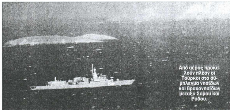
Από αέρος προκάλουν πλέον οι Τούρκοι στο σύμπλεγμα νησιών και βραχονησίδων μεταξύ Σάμου και Ρόδου.

Συνολικά κατά το 1999 σε σχέση με τη δραστηριότητα κατά το '98, παρατηρήθηκε μείωση των παραβάσεων κατά 40%, αύξηση των παραβιάσεων κατά 8% και μείωση των ε-