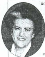
Γράφει η Άννα Παναγιωταρέα

Επίσης, για να συμπληρώσω την εικόνα, ουδόλως με ενδιαφέρουν οι ερωτικές ιδιαιτερότητες γνωστού μόδιστρο, οι οποίες αναλύονταν στο κλαπέν ημερολόγιό του, όπως δεν με ενδιαφέραν ποτέ και οι ενδυματολογικές «δημιουργίες» του.