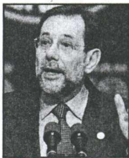
Τον ειδικό ρόλο του διαμεσολαβητή-διαπραγματευτή ανέλαβε ο Χ. Σολάνα.

πρώτες απογευματινές ώρες. Είναι χαρακτηριστικό ότι όταν ο πρωθυπουργός προσήλθε χθες το απόγευμα στο Κέντρο Τύπου για μια μικρή συζήτηση με τους Έλληνες δημοσιογράφους ξένα τηλεοπτικά δίκτυα (όσα πρόλαβαν) έτρεξαν να καλύψουν τις δηλώσεις του.