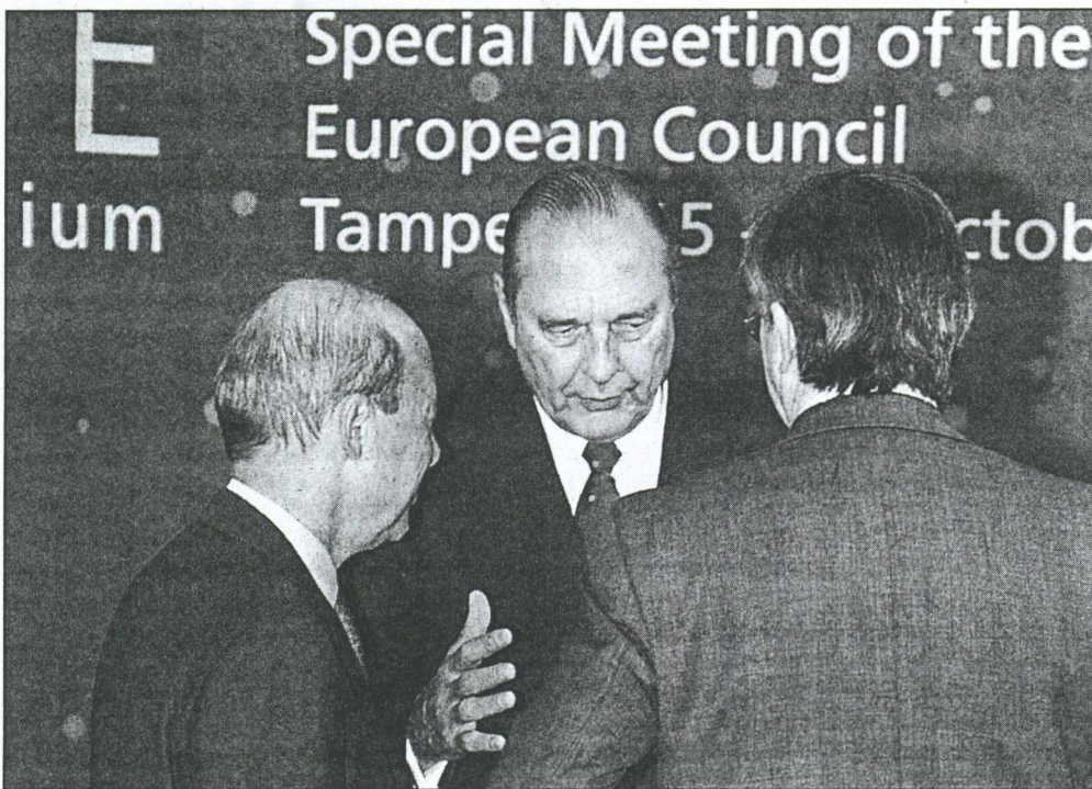
Ο πρωθυπουργός της Ελλάδας Κ. Σημίτης και ο Πρόεδρος της Γαλλίας Ζακ Σιράκ συζητούν στο περιθώριο της έκτακτης Συνόδου Κορυφής που πραγματοποιήθηκε στο Τάμπερε της Φινλανδίας.