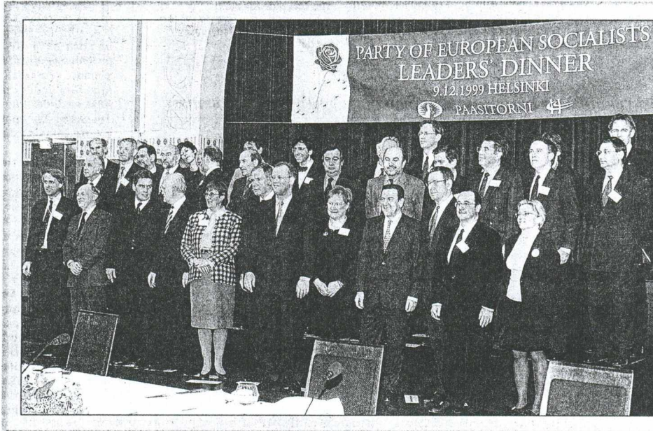
Οι ευρωπαίοι σοσιαλιστές στην αναμνηστική οικογενειακή φωτογραφία μετά τη συνάντησή που είχαν χθες στο Ελσίνκι

Το πρόβλημα της Τσεχίας δεν πρόκειται να συζητηθεί σε βάθος, παρ' όλο που αποτελεί επιδίωξη της Ουάσιγκτον και, ως εκ τούτου, πρέπει να αναμειχθεί η φιλοαμερικανική πτέρυγα της ΕΕ (Ολλανδία, Βρετανία κ.α.) θα επιμείνει να υπάρξει σκληρή απόφαση για τη Μόσχα. Ταυτοχρόνως όμως οι ευρωπαίοι ηγέτες βλέπουν ότι οι στρατιωτικές επιχειρήσεις τερματίζονται, ότι η Ρωσία είναι πάλι κυρία του πακινιδίου και, το