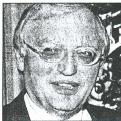
Την αγωνία του για την ευρωπαϊκή προοπτική της Τουρκίας εκφράζει ο επίτροπος αρμόδιος για θέματα διεύρυνσης κ. Γκ. Φερχόιγκεν σε συνεντεύξεις του

είναι έτοιμη για τη διαδικασία της διεύρυνσης», αντίθετα με τις άλλες εν δυνάμει υποψήφιες χώρες, όπως η Κροατία ή η πΔΜ, οι οποίες δεν έχουν λύσει ακόμη τα συνοριακά προβλήματά τους και τα προβλήματα ενόπτιας. Ερωτηθείς για τους φόβους που εκφράζονται μήπως μεταφερθεί ένας «εσωτερικός πόλεμος», αν προχωρήσει η ένταξη της Κύπρου στην ΕΕ, ο επίτροπος υποστήριξε ότι «η ΕΕ δεν επιθυμεί κάτι τέτοιο και δεν θα εγκαταλείψει την ελπίδα να υπάρξει μια λύση σε αυτή τη σύγκρουση».