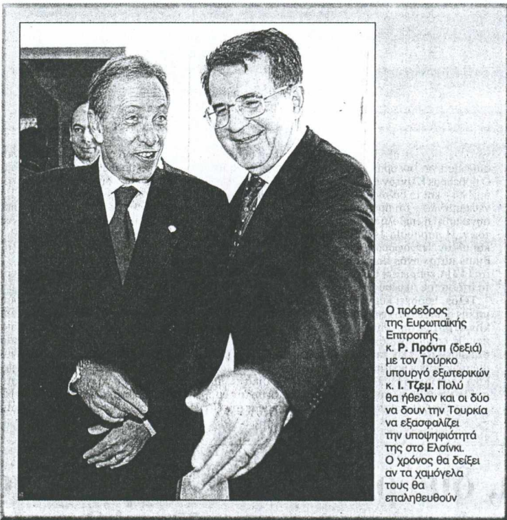
Ο πρόεδρος της Ευρωπαϊκής Επιτροπής κ. Ρ. Πρόνι (δεξιά) με τον Τούρκο υπουργό εξωτερικών κ. Ι. Τζεμ. Πολύ θα ήθελαν και οι δύο να δουν την Τουρκία να εξασφαλίζει την υποψηφιότητά της στο Ελσίνκι. Ο χρόνος θα δείξει αν τα χαμόγελα τους θα επαληθευθούν

ΚΩΝΣΤΑΝΤΙΝΟΥΠΟΛΗ. Με συγκρατημένη αισιοδοξία αντιμετωπίζει η Τουρκία τη Σύνοδο Κορυφής στο Ελσίνκι, παρά τις «προειδοποιήσεις» του υπουργού Εξωτερικών κ. Ισμαήλ Τζεμ ότι δεν θα ήταν «εθνική καταστροφή αν δεν αναγνωριστεί (η Τουρκία) ως υποψήφια στο Ελσίνκι». Η πνευματική ηγεσία της χώρας αντιμετωπίζει ωστόσο διαφορετικά την κρίσιμη συνάντηση του Ελσίνκι, και με επικεφαλής τον συγγραφέα κ. Ορχάν Παμούκ, απευθύνει έκκληση «προς τους οπαδούς της φιλίας και της ειρήνης στην Ελλάδα να μη δώσουν ευκαιρία στους οπαδούς της εχθρότη-