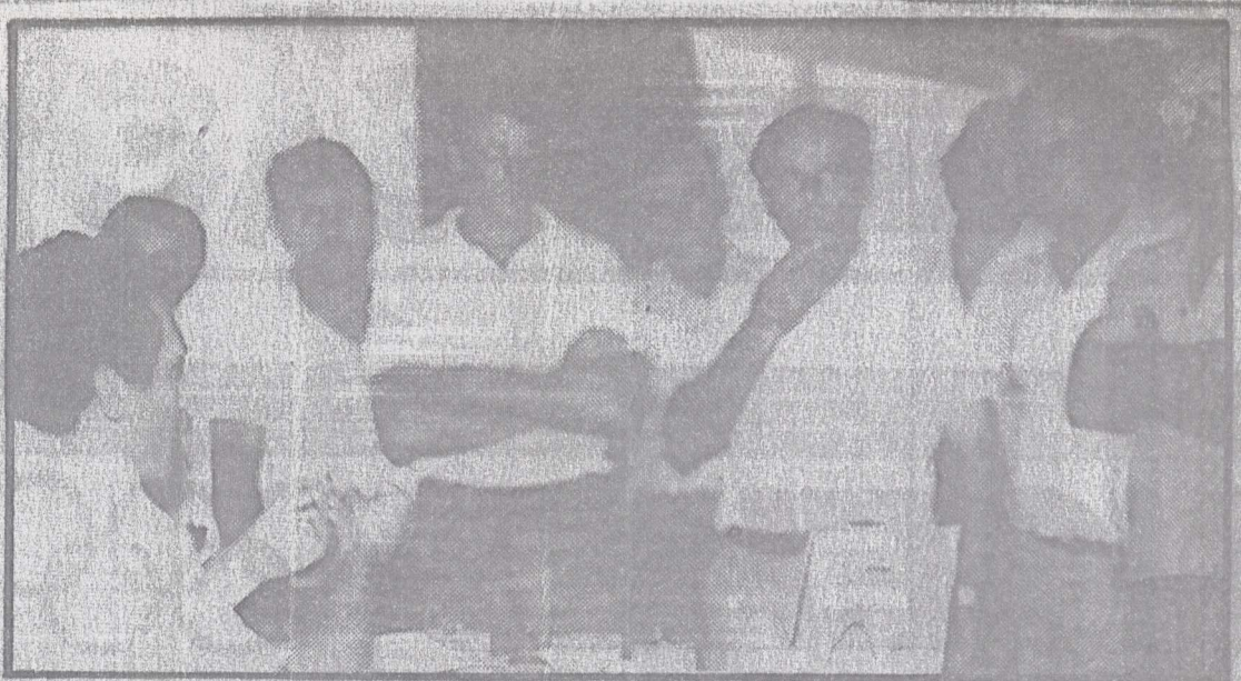
Ο Νομάρχης Λαρίσας με την επιτροπή των τοματοπαραγωγών κατά την χθεσινή τους συνάντηση.