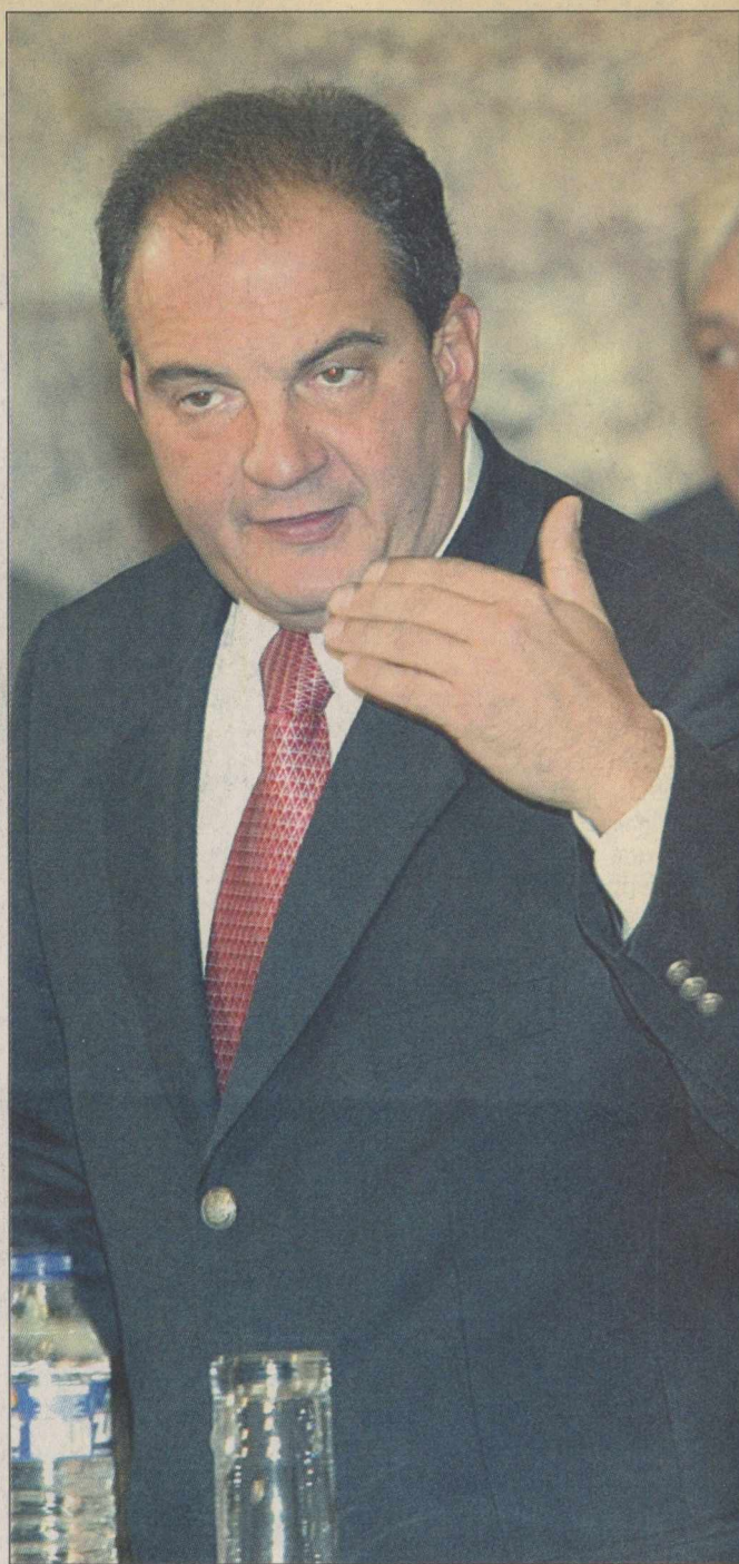
Στην ψήφιση συγκεκριμένων νόμων, όπως αυτός που εισάγει την επιλογή αναδόχων δημοσίων έργων με βάση τον μαθηματικό τύπο, θα αναφερθεί ο κ. Κ. Καραμανλής, κατά την εκτός ημερησίας διατάξεως σε επίπεδο πολιτικών αρχηγών συζήτηση που θα γίνει μεθαύριο στη Βουλή.

προμηθευτές του Δημοσίου προμήθειες ύψους 1,5 τρις. δραχμών, μέσω των προγραμματικών συμφωνιών, σε τιμές πολλές φορές διπλάσιες από εκείνες που ισχύουν διεθνώς.