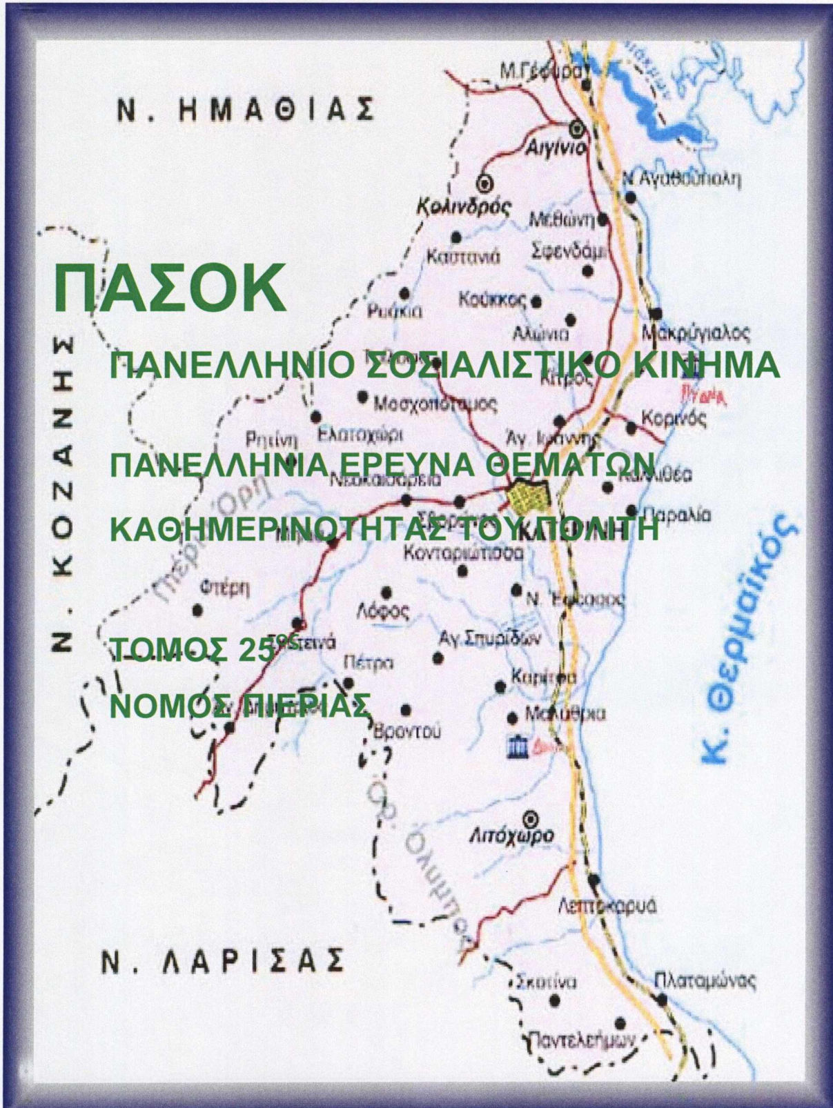
ΕΘΝΙΚΕΣ ΕΚΛΟΓΕΣ 2004