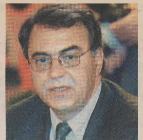
Ο Νίκος Χριστοδουλάκης χαρακτήρισε καταστροφική την αναδιάρθρωση.

ΕΝΤΥΠΩΣΗ προκάλεσε και η ομόθυμη αρνητική στάση στη συνέντευξη του πρώην πρωθυπουργού και των συνομιλητών του που αυτή τη στιγμή βρίσκονται εκτός Βουλής. Από τον Ν. Χριστοδουλάκη και τον Χρ. Βερελή που έχουν αναφερθεί μέχρι τον Ν. Μπίστη κ.ά. Πέραν της ουσιαστικής διαφωνίας, όλοι έλεγαν, στίς κατ' ιδίαν συνομιλίες τους, πως αν ήθελε να πει κάτι τόσο σοβαρό είχε πολλούς τρόπους να το κάνει χωρίς συνέντευξη. Να πάρει μια πρωτοβουλία στην Ευρώπη, να ενημερώσει τον Γ. Παπανδρέου. Μόνο που ο Κ. Σημίτης δεν συνθηχίζει να μοιράζεται με κανέναν τις στρατηγικές του επιλογές. Τις κάνει, και όποιος θέλει ακολουθεί,