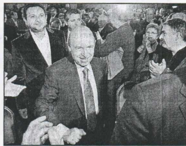
Ο Κ. Σημίτης χειροκροτείται ενώ προσέρχεται στο χώρο της ομιλίας του στο Ηράκλειο

«Δύο χρόνια σταισιμότητας και οπισθοδρόμησης» χαρακτήρισε ο Κώστας Σημίτης τα δύο χρόνια της κυβέρνησης της Ν.Δ. και επέκρινε μία προς μία όλες τις βασικές επιλογές της. «Η τύχη και ο αυτόματος πιλότος καθορίζουν την πορεία της χώρας», υποστήριξε.