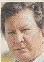
ΤΟΥ ΑΝΤΩΝΗ ΚΑΡΑΚΟΥΣΗ

Εκανε πράγματι το «καλύτερο δυνατόν», αλλά λόγω της σύγχυσης αρμοδιοτήτων μεταξύ δήμων, νομαρχιών και κράτους μία ακόμη ημέρα χιονοθύελλας θα ήταν αρκετή για να χρειαστούμε διαπραγματευτή του ΟΗΕ να αποφασίσει ποιος θα ρίξει το αλάτι στους δρόμους.