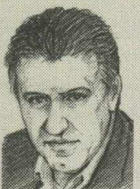
Του ΓΙΩΡΓΟΥ ΛΑΚΟΠΟΥΛΟΥ

Για ποιον «δουλεύει» ο Κώστας Σημίτης με τη στροφή που έκανε στα Ευρωτουρκικά; Στις κυβερνήσεις του το «υποστηρίζουμε την πλήρη ένταξη των Τούρκων» ήταν το υπέρτατο δόγμα εξωτερικής πολιτικής. Από το Κέμπριτζ τώρα ο ίδιος ζήτησε ειδική σχέση. Γιατί άρχισε ξαφνικά να καίει την πολιτική του; Τρεις είναι οι ερμηνείες.